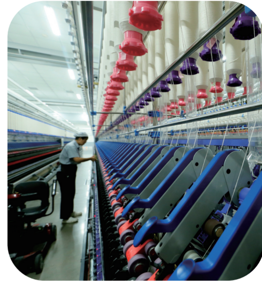
日前,工人在位于山东省青岛市即墨区龙山街道的一家纺织科技有限公司智慧纺纱生产线上生产高端纤维。

产业兴、人才足、前景广,吉林新电商产业发展正当其时。面对新电商行业发展的新机遇与新挑战,我省正深入研究“新质生产力”与“新电商”的桥梁纽带,以产业集聚化、平台规模化、市场全球化为路径,全力推动新电商产业跨越式发展,为率先实现新突破打造强力引擎。