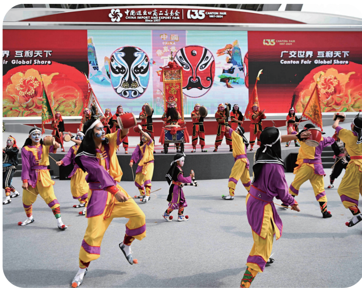
日前,来自广东普宁的南山英歌队在第135届广交会上进行英歌舞展演。4月15日,第135届中国进出口商品交易会开幕。来自广东普宁的南山英歌队进行的英歌舞展演吸引各国采购商、参展商驻足观看。