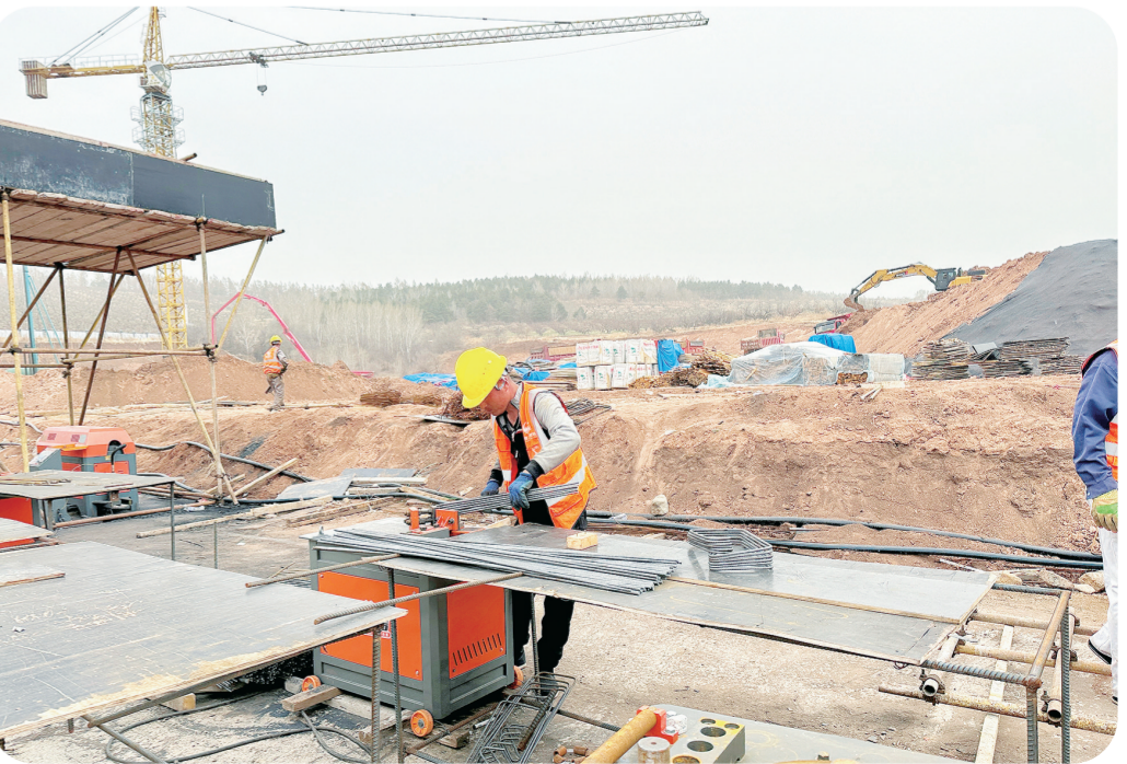
龙井市木制品深加工产业园基础设施建设项目计划总投资3.47亿元,占地面积73516.25平方米,建筑面积81412.21平方米,于2023年3月开工建设,预计今年9月末竣工。项目建成投产达产后,预计实现年产值1.5亿元,上缴税金1250万元。

今年,延边州继续秉持“项目为王”工作理念,纳入省级考核系统的5000万元以上重点项目260个,总投资1347.8亿元,年度计划投资