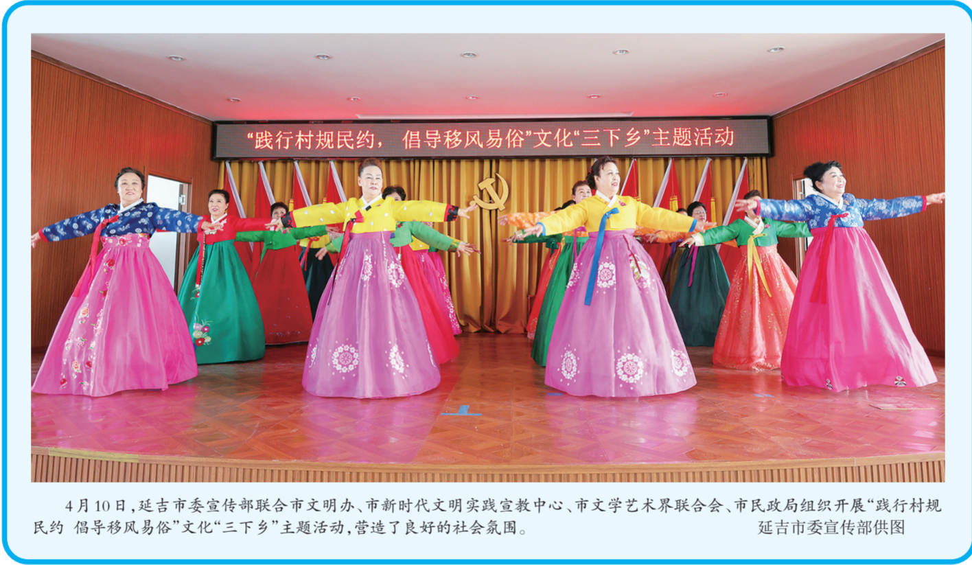
4月10日,延吉市委宣传部联合市文明办、市新时代文明实践宣教中心、市文学艺术界联合会、市民政局组织开展“践行村规民约 倡导移风易俗”文化“三下乡”主题活动,营造了良好的社会氛围。

与此同时,珲春出入境边防检查站坚持主动作为,不断调整勤务模式,科学建立勤务轮换制度、优化设定岗位配置和警力部署,保证铁路口岸24小时勤务工作高效运转。针对俄方列车入境时间不固定的情况,与东北亚铁路集团建立预报联络机制,提前掌握入境员工、货物及列车行驶情况等信息,实行即到、即查、即放,保障国际货运列车安全高效运行。