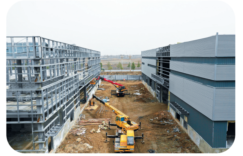
梅河口市装配式建筑产业园项目。

项目建成后，主要生产装配式建筑的部品部件、模块化建筑和装配式整装新材料等。该项目以打造全省