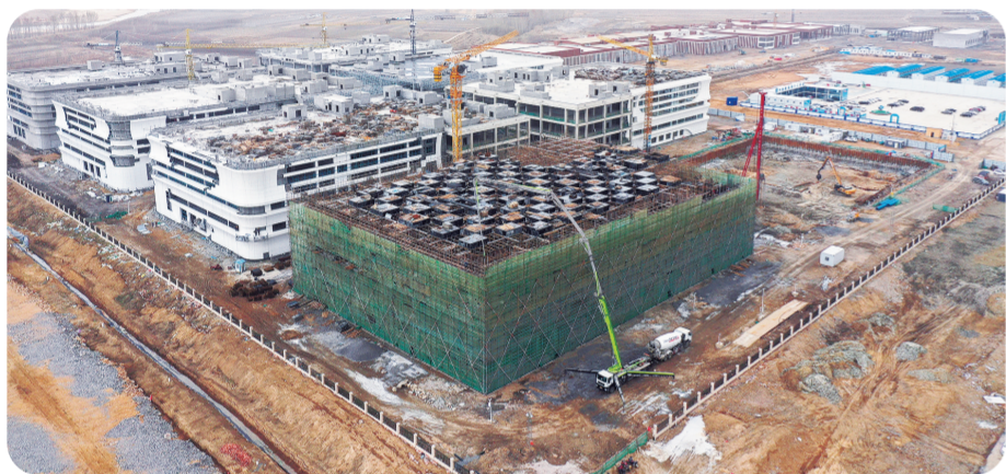
梅河口市肉牛产业融合示范园项目。

朝天，一个个项目高歌猛进，每一片区域、每一处角落，都能看到奋进者奔跑的身影、争先的姿态，梅河口正以“向春而行、奋力奔跑”的姿态奏响重点项目建设发展的“春之序曲”。