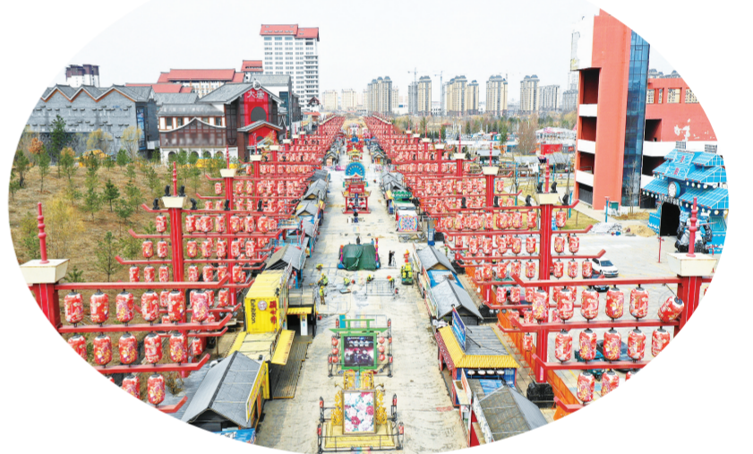
东北不夜城升级改造项目。

结合龙年元素，对南、北门头进行重点改造。注重主街区与陕西街等街区的赋能导流，联动融合。强化陕西街和四川街地域元素。月亮湾游玩区域将免费对游客开放。云南