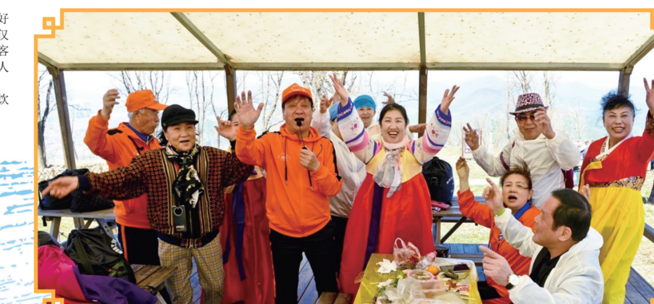
开江鱼美食节上，围着餐桌载歌载舞的朝鲜族同胞。