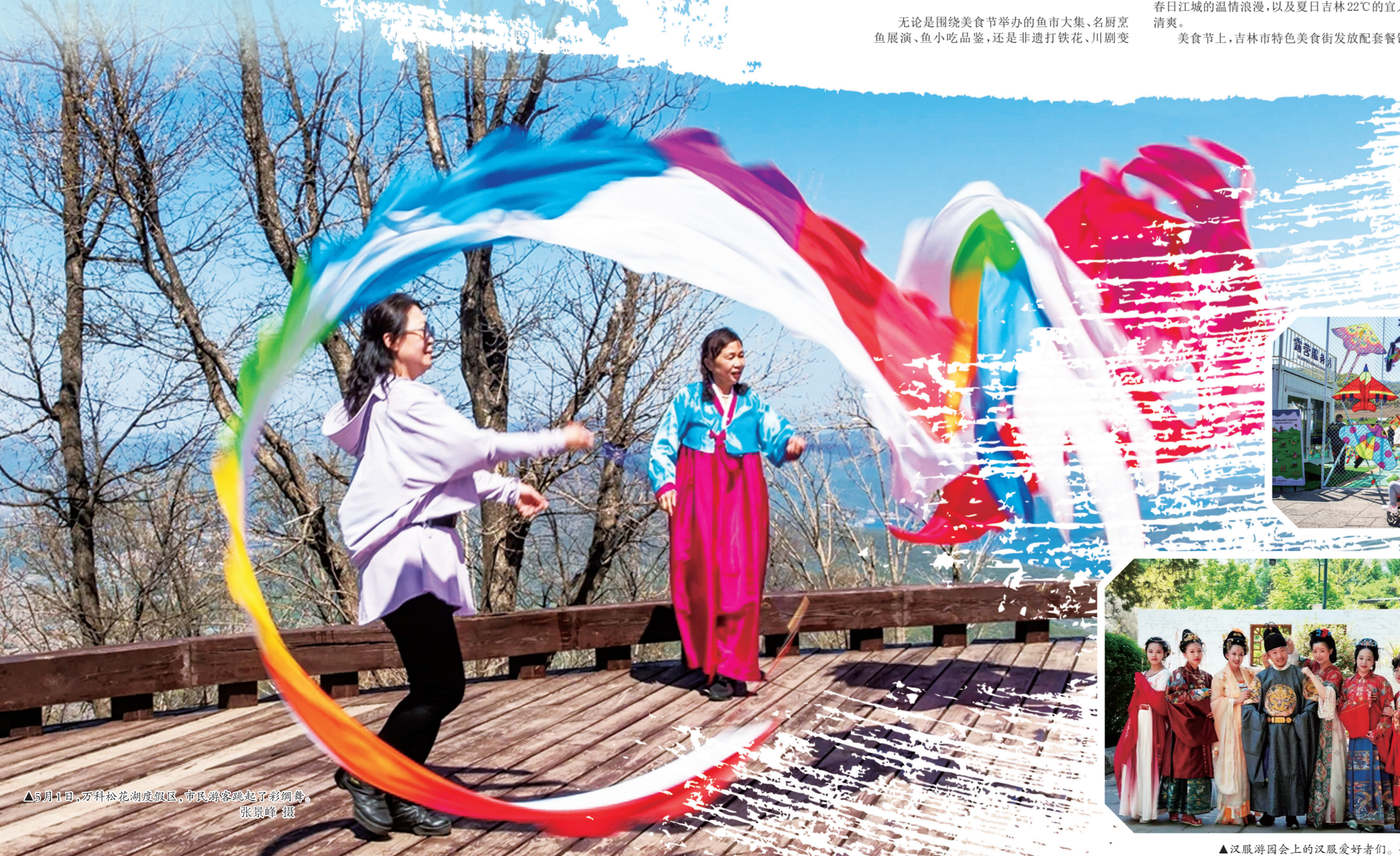
5月1日，万科松花湖度假区，市民游客在景区内游玩。