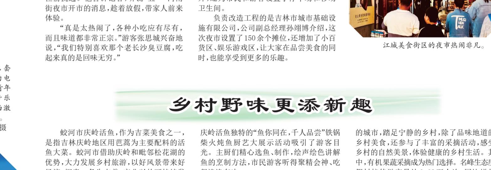
蛟河市庆岭镇活动现场