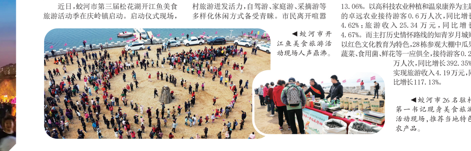
蛟河市开江鱼美食旅游活动现场