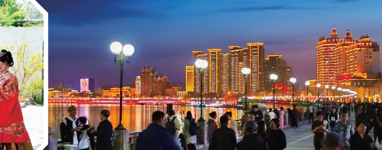
汉服游园会上的汉服爱好者们。