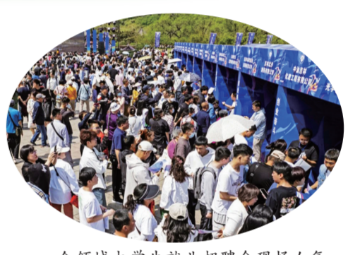
全领域大学生就业招聘会现场人气爆棚。

“这次招聘会的人才引进政策很友好，还给我们提供免费的住宿和交通补贴，我心里更有底气了。”