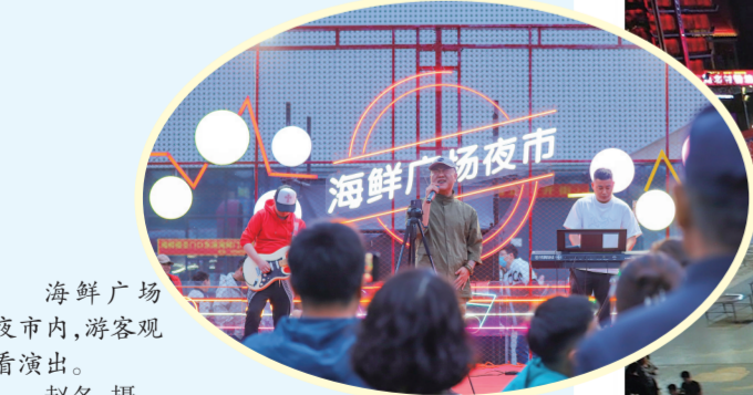
海鲜广场夜市内，游客观看演出。