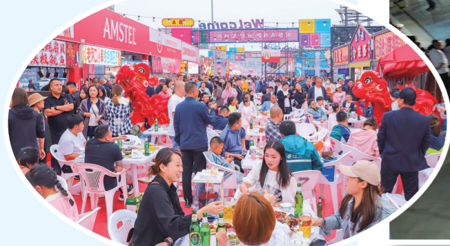
亲朋好友围坐，一起畅饮啤酒。