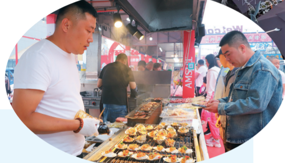
烤扇贝的鲜美，让人“爱不释手”。