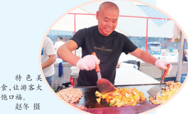
特色美食，让游客大饱口福。