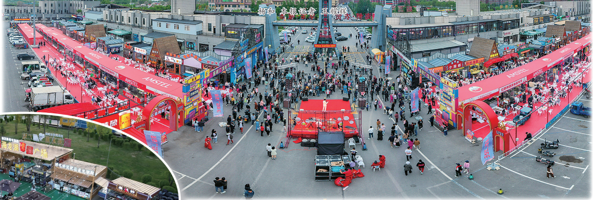
梅河口海鲜广场夜市。