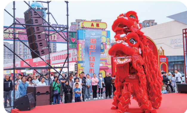
海鲜夜市，舞狮表演。

好景好水好去处。梅河口市新发展餐饮集团还将结合海龙湖优美的景观，把生态人文历史等融合在一起，继续打造全民共享的文旅主题活动，努力推动“旅游+”多元融合发展，促进区域消费升级，打造梅河口文旅靓丽新名片。