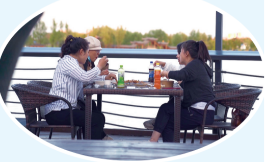
美景美食，开心每一刻。