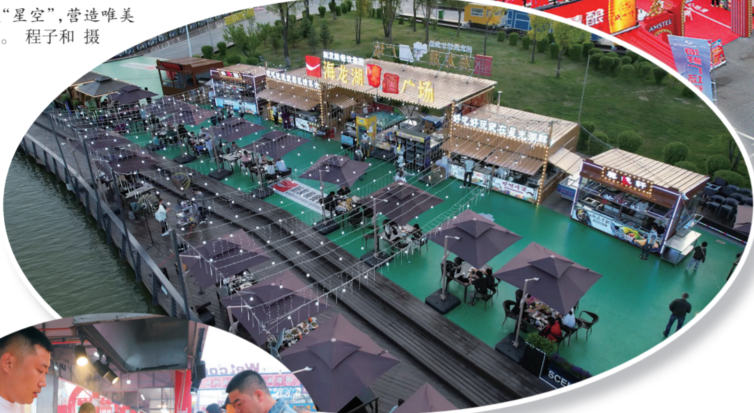
浪漫“星空”，营造唯美静谧氛围。

初夏时节，绿荫遍野，花丛蝶忙。在梅河口山水广场，霓虹闪烁人流如织，城市烧烤节尽显蓬勃生机；在海龙湖，游客络绎不绝，拍照打卡。夜幕降临，游人休憩，依亭观澜，赏湖光夜色，听民谣弹唱，饮精酿啤酒，甚是惬意；在海鲜夜市，民族舞蹈、川剧变脸、魔术、杂技等表演轮番上演，沉浸式实景演出吸引八方游客。 “美食搭台，文旅唱戏。”梅河口这座新兴的旅游城市，在初夏时节，烧烤节开幕、啤酒广场营业、海鲜夜市开街等活动接连涌现，串珠成链，“美食经济”成为当地的一道亮丽风景线。不断丰富的消费供给，不断涌现的新产品、新业态，正持续激发梅河口市夏日文旅市场的消费活力，也为梅河口市经济高质量发展注入了新动力！