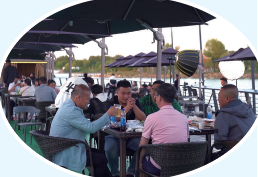
海龙湖啤酒广场，游客赏美景品美食。