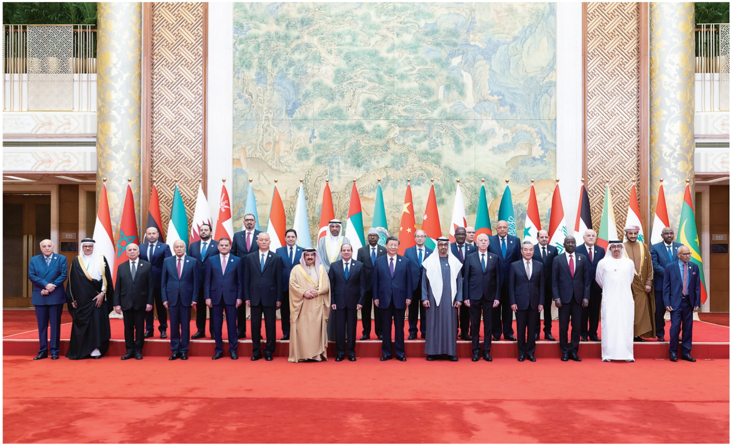
5月30日上午,国家主席习近平在北京钓鱼台国宾馆出席中阿合作论坛第十届部长级会议开幕式并发表主旨讲话。这是习近平同巴林国王哈马德、埃及总统塞西、突尼斯总统赛义德、阿联酋总统穆罕默德、阿盟秘书长盖特以及22位阿拉伯国家代表团团长集体合影。