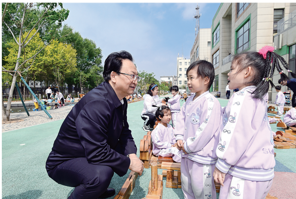
在“六一”国际儿童节即将到来之际，省委书记景俊海近日来到长春市实验幼儿园，祝孩子们节日快乐，并代表省委、省政府向全省各族少年儿童致以亲切问候。

本报(记者黄莺 王艺博)在“六一”国际儿童节即将到来之际，省委书记景俊海近日在长春与孩子们共庆节日，并代表省委、省政府向全省各族少年儿童致以亲切