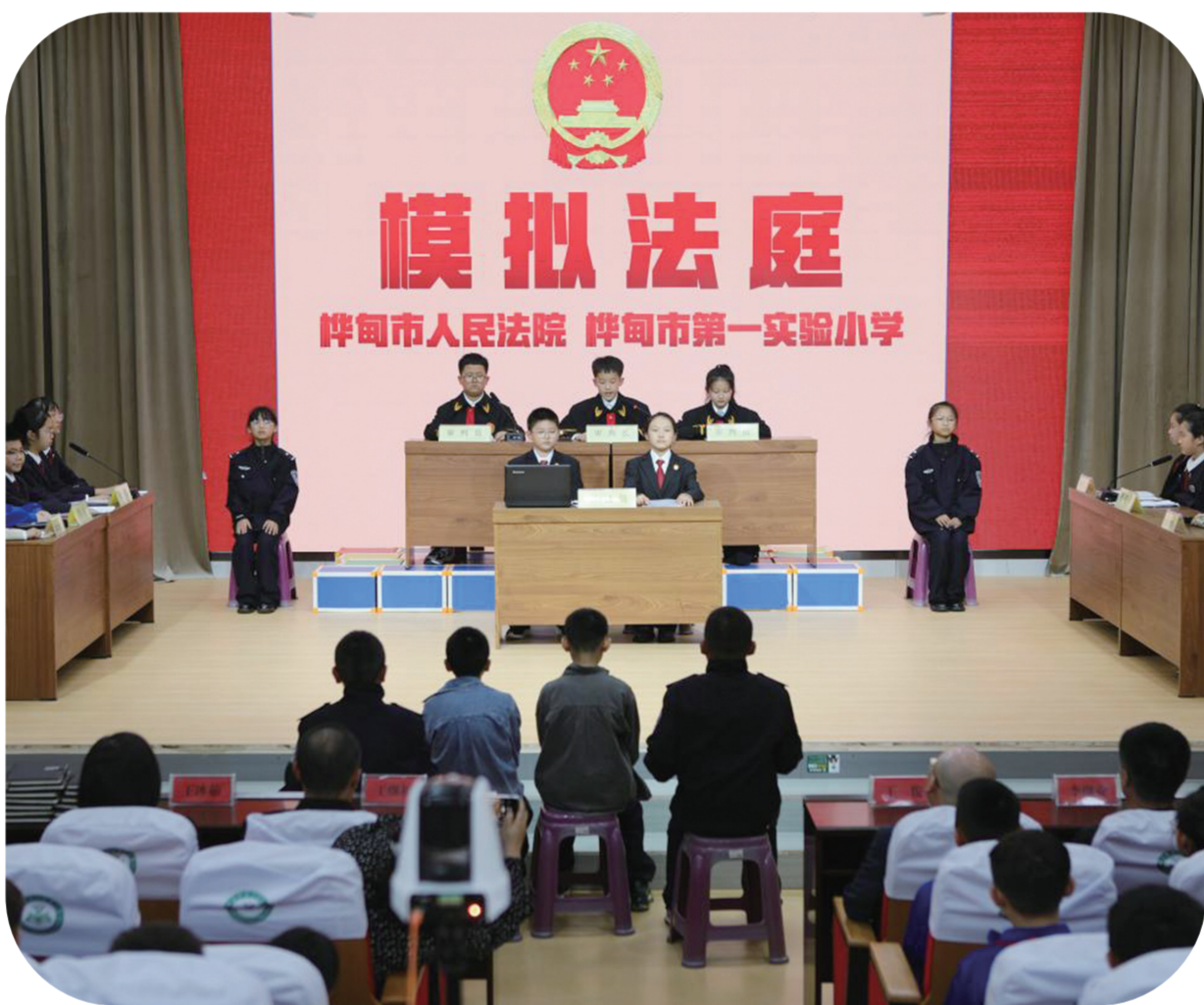
近日,桦甸市人民法院联合桦甸市第一实验小学开展了一次沉浸式“模拟法庭”活动,为全校师生搭建了一个亲近司法、了解法律的平台,助力青少年更好地理解法律知识,培养法治思维和法治意识。

他们组织社区民警深入学校开展以防欺凌、防暴力、防溺水、禁毒等为主题的法治进校园宣传教育活动,向师生传授防抢、防欺凌、远离黄赌毒等常识技能,有效引导学生明确法律底线和行为边界,强化遵法守法意识。采取现场讲解、发放宣传资料、以案说法等形式,在专题讲座、“护学岗”等工作中,向师生及家长普及防诈骗知识。