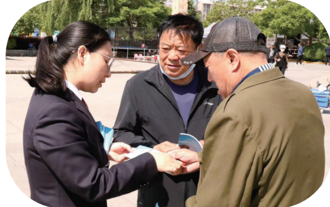
近日,公主岭市人民检察院第四检察部组织干警来到新世纪广场等地开展“美好生活《民法典》相伴”普法活动。检察干警向过往群众宣传《民法典》相关内容,围绕婚姻家庭、财产纠纷让《民法典》知识走到群众身边,走进群众心里。

近日,通化分局联合省交通运输综合行政执法局通化分局开展联合执法行动。行动中,两部门高效联动、紧密协作,严格依照法律法规,坚决做到“发现一起、查处一起”。在执法的同时,民警现场开展普法宣传活动,讲解非法营运车辆和超限超载车辆的危害,积极引导驾驶员、乘客自觉遵守交通法律法规。通过此次联合执法行动,打击了一批非法营运车辆和超限超载行为,形成了道路交通安全齐抓共管的良好局面,有效净化了辖区通行环境。