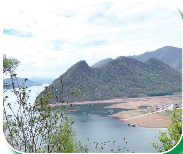
集安市杨木林村是吉林省西南门户第一村。