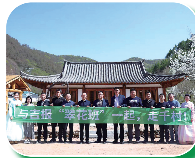
“翠花走千村”栏目组记者走进边境村。