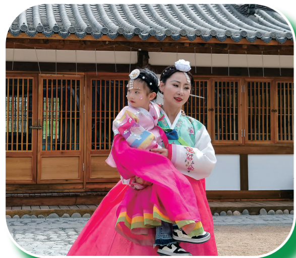
边境村朝鲜族风情浓厚吸引游客前来打卡。