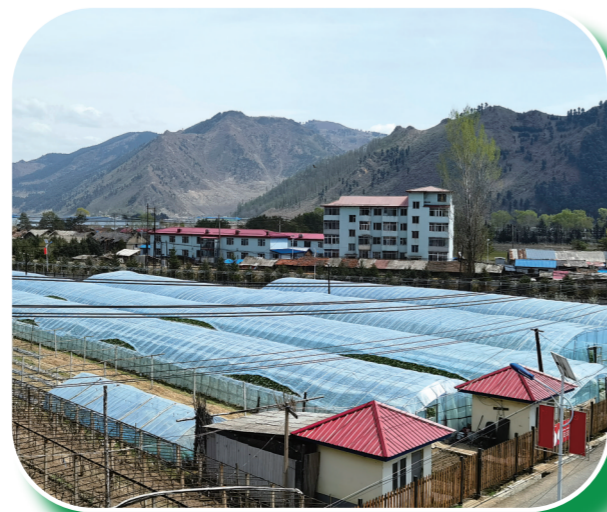
临江市望江村的特色种植产业成为乡村振兴“新引擎”。