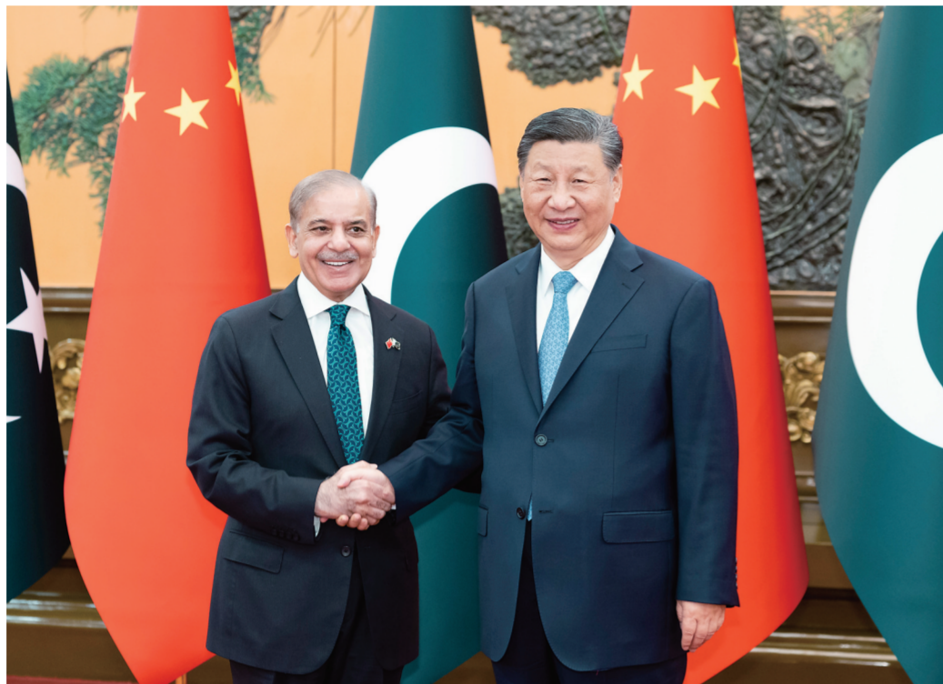
6月7日下午,国家主席习近平在北京人民大会堂会见来华正式访问的巴基斯坦总理夏巴兹。

新华社北京6月7日电(记者孙奕)6月7日下午,国家主席习近平在北京人民大会堂会见来华正式访问的巴基斯坦总理夏巴兹。习近平指出,中国和巴基斯坦是山水相连的好邻居、信义相交的好朋友,更是守望相助的好伙伴、患难与共的好兄弟。中巴全天候战略合作伙伴关系不断深化,拥有坚实的民意基础、强大的内生动力、广阔的发展前景。中方愿同巴方坚定相互支持,拉紧合作纽带,深化战略协调,加快构建新时代更加紧密的中巴命运共同体,为地区和平、稳定、发展、繁荣作出更大贡献。习近平强调,中巴铁杆友谊历久弥坚,关键在于双方始终相互理解、高度信任、坚定支持。 (下转第三版)