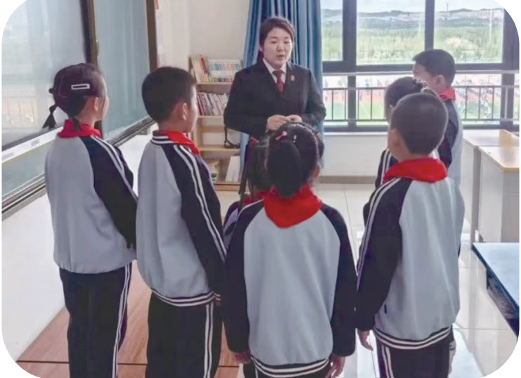
日前，辽源市西安区人民法院刑事庭干警积极履行法治副校长职责，走进西安区灯塔镇中心小学，把犯罪预防、家庭教育等法律知识教给学生，教育引导同学们自觉遵守法律，加强自我保护意识，帮助同学们提高对校园暴力事件的分辨、应对能力。

明晰协作业务流程。明确告知不动产拍卖涉税征收事项、公示税费信息，更好地维护各方当事人合法权益，传递不动产拍卖成交信息，并进行税费测算。