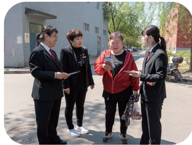
日前，吉林铁路运输法院联手吉林铁路运输检察院和吉林经济技术开发区双飞社区在公园、早市等人员密集的地方，开展防范电信诈骗宣传活动。这是他们在向居民介绍电信诈骗案例，以案说法，提醒居民提高防范意识，营造社区“人人反诈、人人参与、人人宣传”的良好氛围。

接下来，靖宇县公安局出入境管理大队将进一步优化服务流程，拓展服务范围，积极回应群众关切，不断创新服务模式，为群众提供更加便捷、高效、优质的政务服务，努力提升群众获得感、幸福感和满意度。