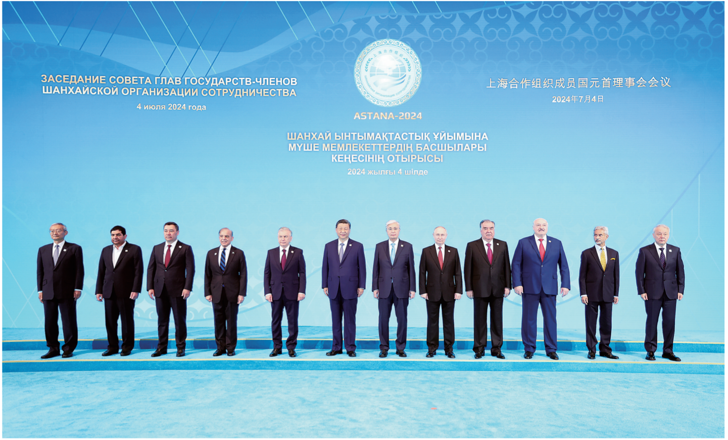
当地时间7月4日上午,国家主席习近平在阿斯塔纳独立宫出席上海合作组织成员国元首理事会第二十四次会议。这是习近平同上海合作组织成员国领导人集体合影。

新华社阿斯塔纳7月4日电(记者胡晓光 韩墨 杨依军)当地时间7月4日上午,国家主席习近平在阿斯塔纳独立宫出席上海合作组织成员国元首理事会第二十四次会议。