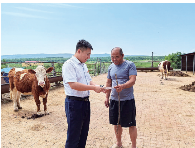
安图农商银行工作人员走访养殖户。

安图农商银行深入贯彻落实金融助力“千万头肉牛”建设工程要求，结合当地肉牛产业发展情况，统筹调配信贷资金，制定当年新增1700万元的贷款投放目标，做到应贷尽贷，全面满足养殖业信贷资金需求。对已建立的“整村授信”数据库和“双