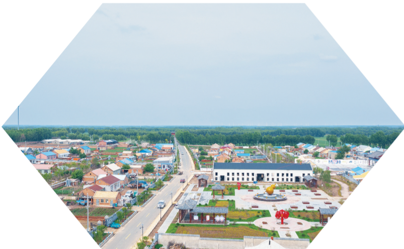
扶余市永平乡九连山村。

未来，扶余市将继续加大乡村旅游发展的力度，通过优化经济结构、拓展乡村旅游项目、提升公共服务水平等措施，推动乡村旅游产业做大做强。同时，加强与周边地区的合作与交流，共同打造更具吸引力和竞争力的乡村旅游品牌，为乡村振兴注入新的动力和活力。