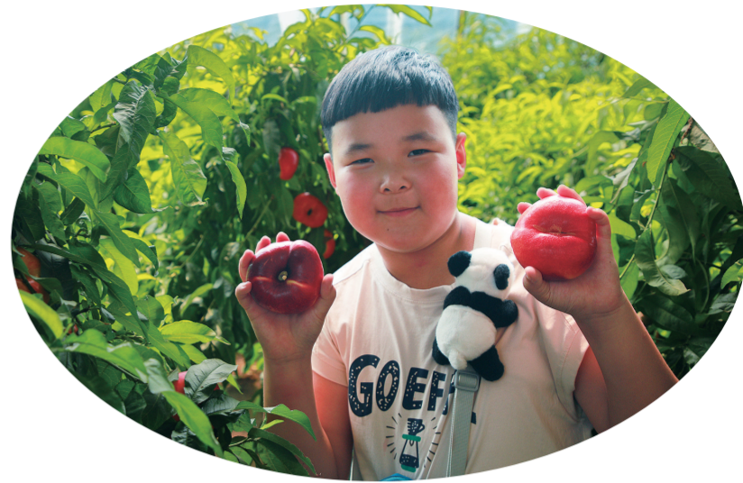
宁江区伯都乡杨家村蜜桃喜获丰收，吸引了众多游客采摘。

感受自然韵味，体会乡村生活。在森林景观、田园风光、民俗文化的映衬下，宁江区的乡村旅游业正展现出勃勃生机和无限魅力，向着更加美好的明天迈进。