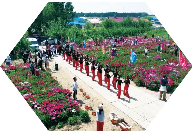
长岭县昕华源的芍药花竞相绽放，随风舞动。

接下来，长岭县将继续加大乡村旅游发展力度，通过提升服务质量、创新旅游产品、拓展旅游市场等措施，打造具有地方特色的乡村旅游品牌。同时，不断加强周边地区的合作与交流，共同推动区域旅游产业繁荣发展。