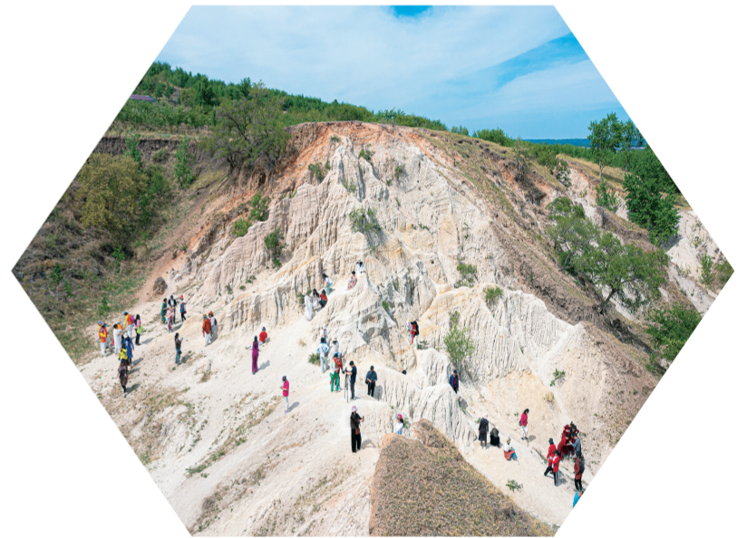
前郭县哈拉毛都镇特色景点。

截至目前，前郭县已成功培育出5家A级旅游景区、1家省级旅游休闲街区、3家A级旅游景区、10家A级乡村旅游经营单位，并打造了1个全国乡村旅游重点镇、2个全国乡村旅游重点村、3个省级乡村旅游重点镇、1个省级乡村旅游精品村以及7个省级乡村旅游重点村。更有4条乡村旅游线路入选全国乡村旅游精品线路。去年4月，前郭县凭借其在乡村旅游领域的卓越表现，被国际旅游联合会评为“中国最美乡村旅游名县”。