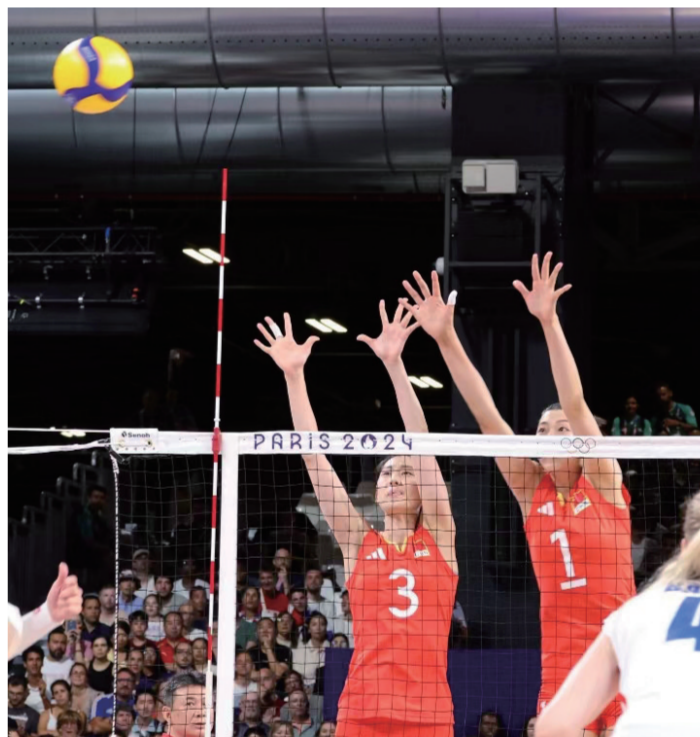
▶ 北京时间8月2日凌晨,中国女排迎来巴黎奥运会第二个小组赛对手、东道主法国女排,最终中国女排3比0横扫对手,在取得小组赛两连胜的同时,提前从小组出线。

吉林省体育局射击射箭运动管理中心副主任、张琼月的主教练张付全程观看了比赛,他对记者说:“整场比赛的过程非常激烈,比赛结果虽然有些遗憾,但这也是竞技体育的魅力。希望张琼月能够通过这场比赛总结经验,走下领奖台的这一刻一切从零开始,继续刻苦努力训练,争取在四年之后能够站在最高的领奖台上。”