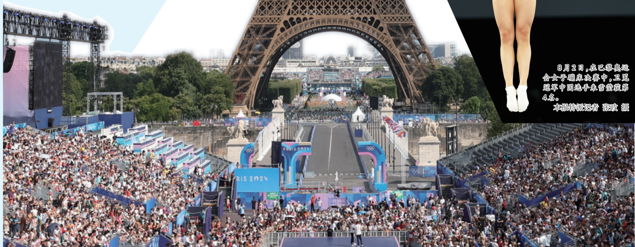
8月2日,在巴黎奥运会女子蹦床决赛中,卫冕冠军中国选手朱雪莹获得第4名。