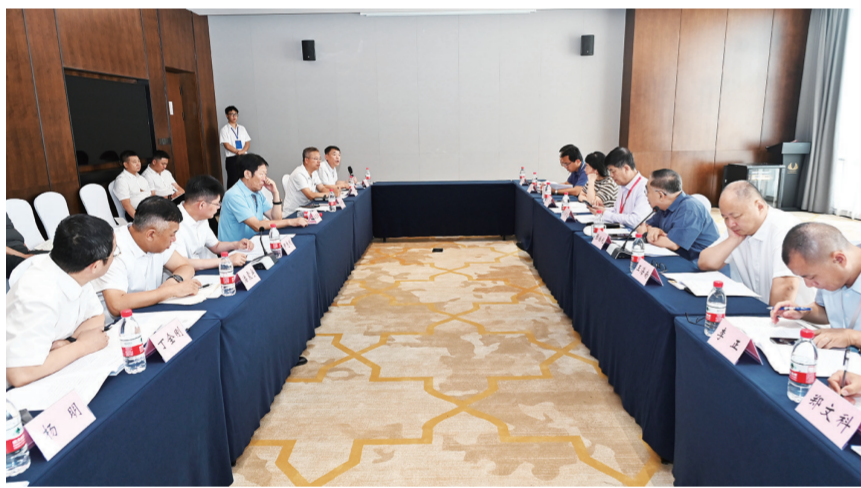
通化市中药大品种高质量发展专家咨询会现场。

理局药品注册司副司长王海南，浙江大学药学院教授程翼宇，分别就《中医药新质生产力发展》《中药研究底层核心技术与产业发展》《中药注册管理改革与中药高质量发展》《智慧制药赋能中药工业新质生产力发展》做主题报告。“推动通化医药产业高质量发展，抓手就是新质生产力。通化市在化药、生物制药、中药等领域都有好的产业基础，特别是中药独家品种就有130多种。我们希望通过全国专家来这里介绍先进的经验，推动通化培育大规模产业，实现数字制药达到水平。同时，通过大品种战略带动，推动通化生物医药产业，特别是中医药产业升级换代。”张伯礼说。交流会上，思想、信息、经验、智慧、成果……汇集聚拢，“头脑风暴”引发与会人员更深层次的思考。“这次活动带来许多关于医药产业的前沿资讯和政策，关于新质生产力的解读也给我们带来全新视角。安睿特重