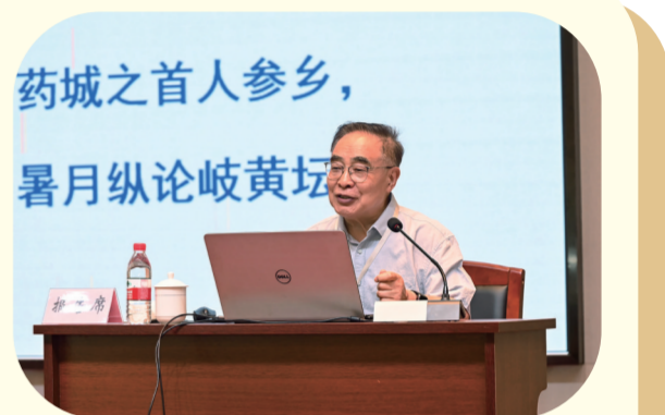
中国工程院院士、医药卫生学部主任、国医大师张伯礼作“中医药新质生产力发展”主题报告。