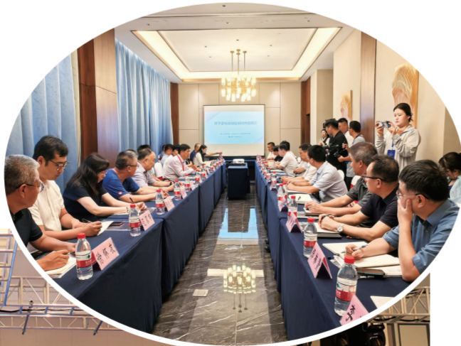
▶林下山参标准制定座谈会现场。 ▼林下山参标准制定启动仪式。