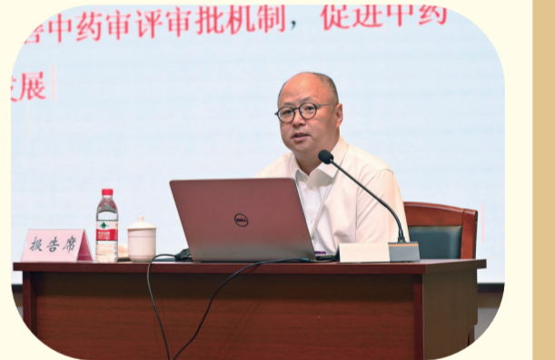
国家药品监督管理局药品注册司副司长王海南作“中药注册管理改革与中药高质量发展”主题报告。