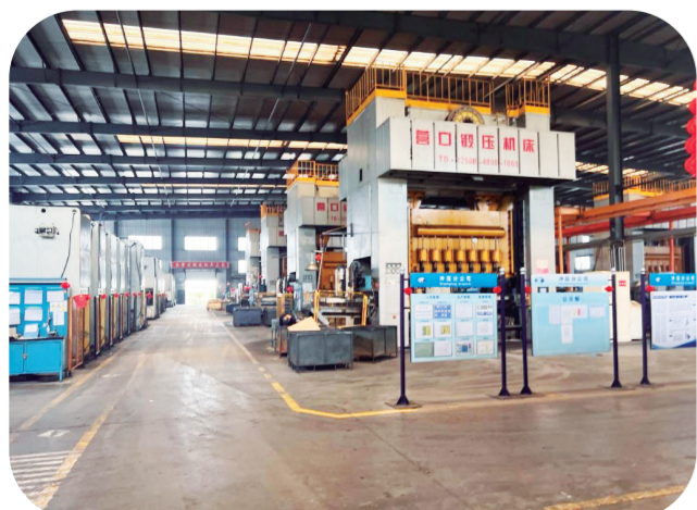
中国银行吉林省分行信贷支持某高新技术企业的生产车间。

中国银行吉林省分行持续加大对新产业、新模式、新动能的支持力度，助推科技企业创新升级。