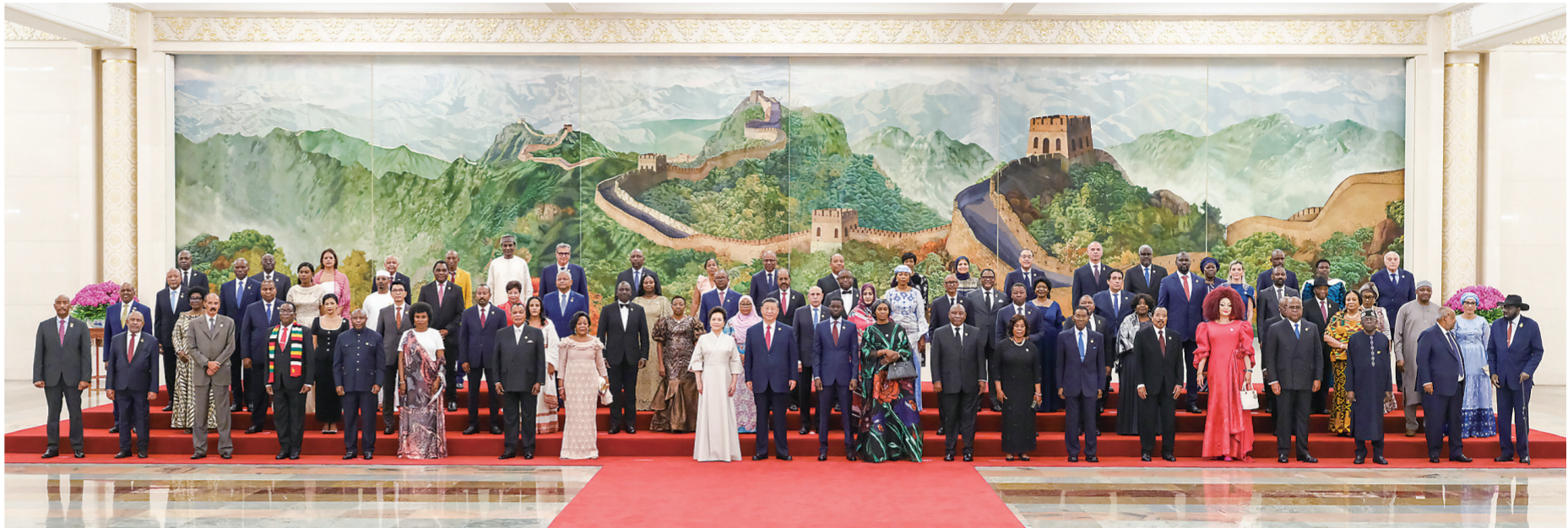
9月4日晚,国家主席习近平和夫人彭丽媛在北京人民大会堂举行宴会,欢迎来华出席中非合作论坛北京峰会的非方及国际贵宾。这是宴会前,习近平和彭丽媛同贵宾们集体合影留念。

新华社北京9月4日电(记者温馨 董雪)9月4日晚,国家主席习近平和夫人彭丽媛在北京人民大会堂举行宴会,欢迎来华出席中非合作论坛北京峰会的非方及国际贵宾。这是习近平发表致辞。