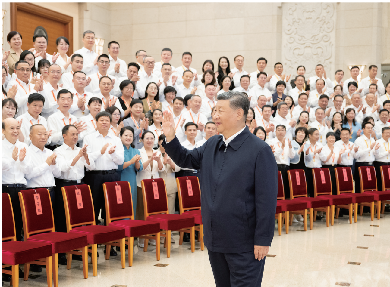
九月九日,党和国家领导人习近平、李强、蔡奇、丁薛祥等在北京接见参加庆祝第四十个教师节暨全国教育系统先进集体和先进个人表彰活动代表。

新华社北京9月10日电 全国教育大会9日至10日在北京召开。中共中央总书记、国家主席、中央军委主席习近平出席大会并发表重要讲话。他强调,建成教育强国是近代以来中华民族梦寐以求的美好愿望,是实现以中国式现代化全面推进强国建设、民族复兴伟业的先导任务、坚实基础、战略支撑,必须朝着既定目标扎实迈进。9月10日是我国第四十个教师节。习近平代表党中央,向全国广大教师和教育