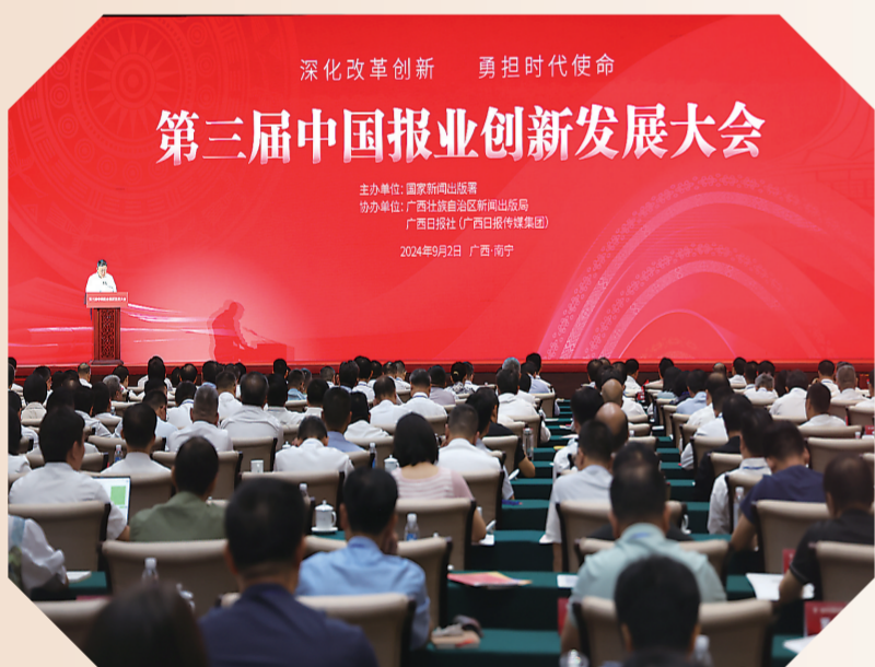
第三届中国报业创新发展大会现场。