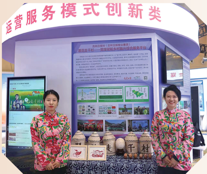
身着东北“翠花”服饰的吉报记者在中国报业创新发展案例展上受到关注。

每一次活动,都是《翠花走千村》栏目对乡村的真情付出;每一次对接,都是“翠花”成长的见证。只要能为乡村带来一点点变化,都能让我们心满意足,干劲满满。