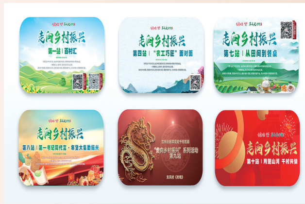
翠花走千村栏目组策划举办的系列活动海报。

8月30日,平原农耕助推吉菜新产业研讨会在四平市举办,这是《翠花走千村》栏目与吉林工商学院、相关市州商务局、吉林省饮食文化研究会共同主办的吉林省区域饮食文化助力地方经济高质量发展研讨会第八站活动。