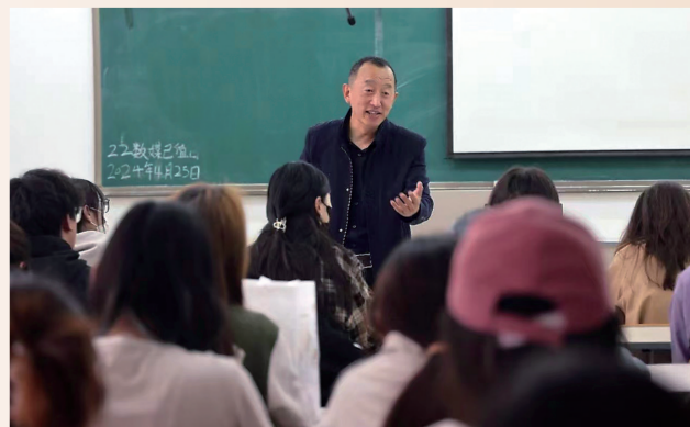
翠花走千村栏目记者走进大学课堂。

群众的意愿在哪里,党报的脉动就传到哪里;群众的呼声在哪里,党报的触角就伸到哪里。《翠花走千村》栏目把新闻报道的触角延伸到了田间地头、村民炕头,火了本土优质农产品,暖了村民的心头,以全媒体传播之力,绘就乡村振兴美丽画卷。