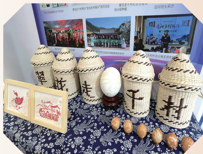
翠花文创产品备受观展者青睐。