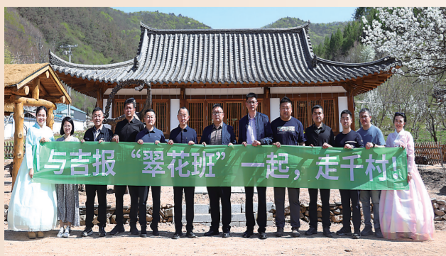
翠花走千村栏目组走进朝鲜族民俗村。

民有所呼,我有所应。作为吉报全媒体改革的“试验田”和创新发展的“示范地”,《翠花走千村》栏目致力打造“吉字