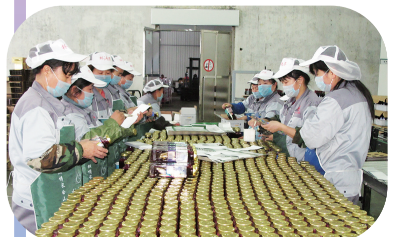
白山市依托特色农产品丰富的优势,大力发展特色产业,助推乡村全面振兴。