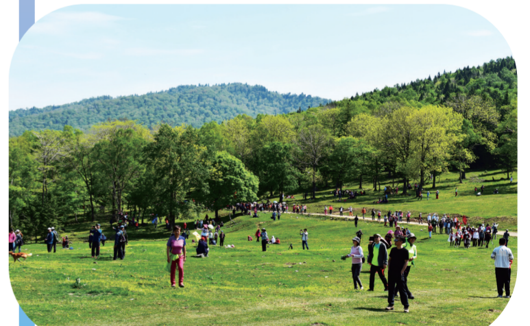
地处长白山腹地的白山市,松花江、鸭绿江穿流而过,自然风光优美,为发展全域旅游产业奠定坚实的基础。图为位于白山市江源区的仙人谷。