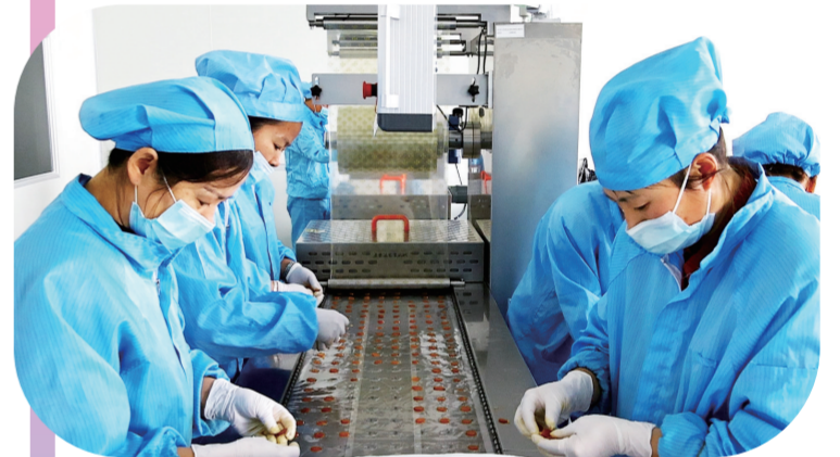
白山市依托丰富的人参资源,加大科技创新力度,研发药品、食品、保健品、化妆品等800多个品种,推动人参产业高质量发展。