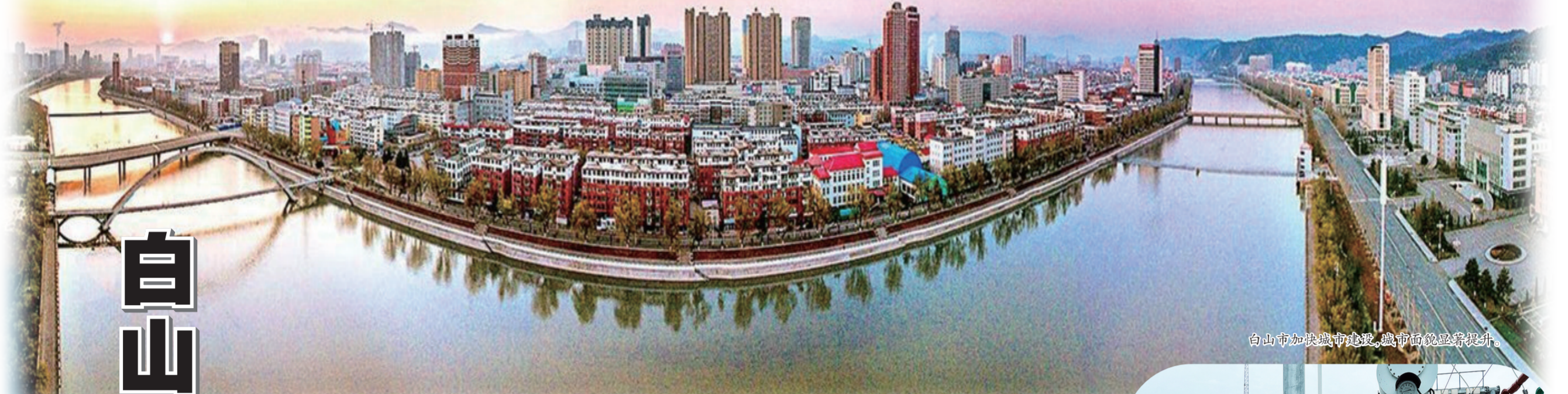
白山市加快城市建设,城市面貌显著提升。