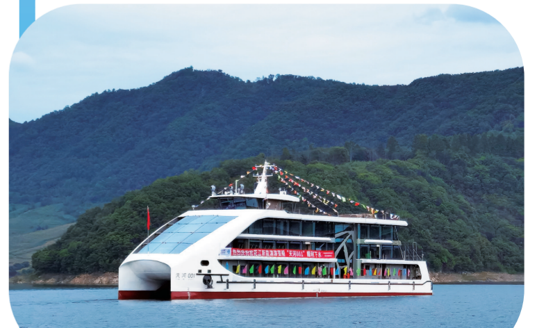
9月4日上午,新能源游览船“天河一号”在靖宇县花园口镇松江码头顺利下水,标志着松花江旅游即将迈进一个全新的绿色智能时代。