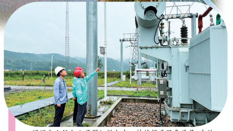
国网白山供电公司浑江供电中心持续提升服务质量,走访关键重点用户,了解涉电诉求,治理办电、用电及涉电安全隐患,激发企业内生动力,促进企业高质量发展。

千帆竞发,奋楫者进。立足资源禀赋和发展基础的白山市,正不断做优做强特色产业和标志性产品,努力打造高质量发展新的增长点,在全省发展大局中贡献更大力量,展现更大担当!