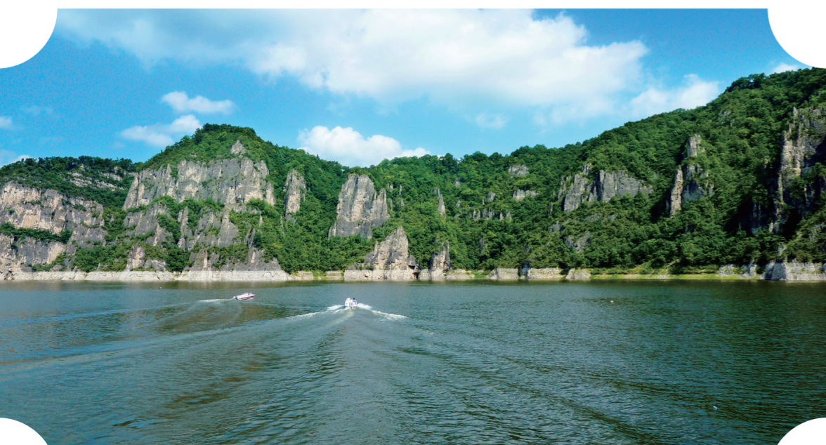
白山市持续升级204.7千米的松花江水上旅游航线,仁义峡驿站、映山红广场等配套项目投入运营,推动全域旅游产业加快发展。