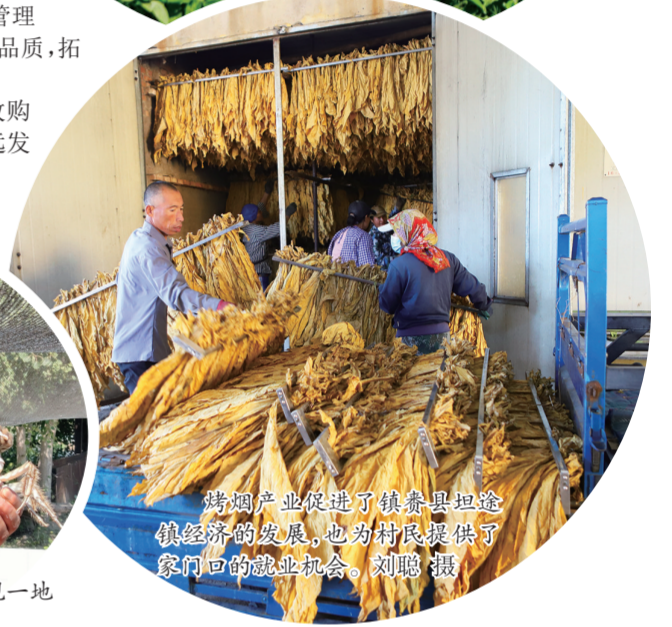
烤烟产业促进了镇赉县坦途镇经济的发展，也为村民提供了家门口的就业机会。