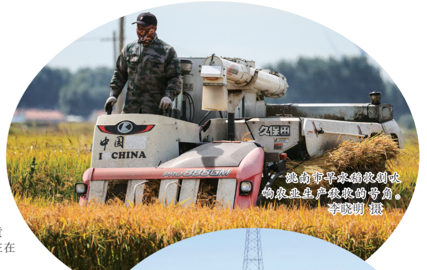
洮南市早水稻收割机吹响农业生产秋收的号角。