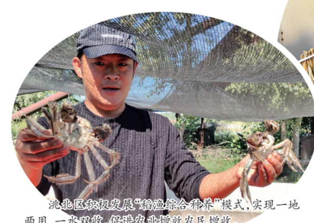
洮北区积极探索“稻蟹综合种养”模式，实现一地两用，一水双收，促进农业增效农民增收。王月彪 何贤亮 摄

当地还通过引入辣椒加工企业，从农民手中收购辣椒，提高辣椒的附加值，为坦途镇辣椒产业的长远发展奠定坚实基础。