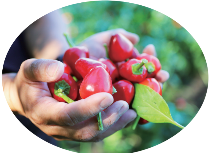
镇赉县坦途镇实施精细化管理，不断提高辣椒的产量和品质。

稻浪翻滚，蟹肥膏黄，硕果飘香。9月以来，白城各地农作物渐次成熟，纵横交错的田野上，欣欣向荣的农家小院里，处处绽放出勃勃生机，置身其中犹如欣赏一幅多彩的风景画，令人心旷神怡。