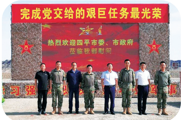
四平市相关领导赴新疆走访慰问驻训官兵。

四平市专门制订了《四平市“红色铸魂引领发展”行动方案》,致力打造全国红色地标城市,强化爱国主义教育基地建设,利用路灯杆、公交站牌、宣传栏等加大“红色四平·英雄旗帜”城市形象主标识的宣传推广力度。与驻四平部队共同建设双拥广场、国防教育主题公园、一江山岛战役红色纪念馆、纪念馆。同时,对革命历史遗迹持续梳理保护,充分利用四平战役纪念馆、四平烈士陵园、塔子山战斗遗址等红色点位,开展爱国主义教育、国防教育和研学活动。