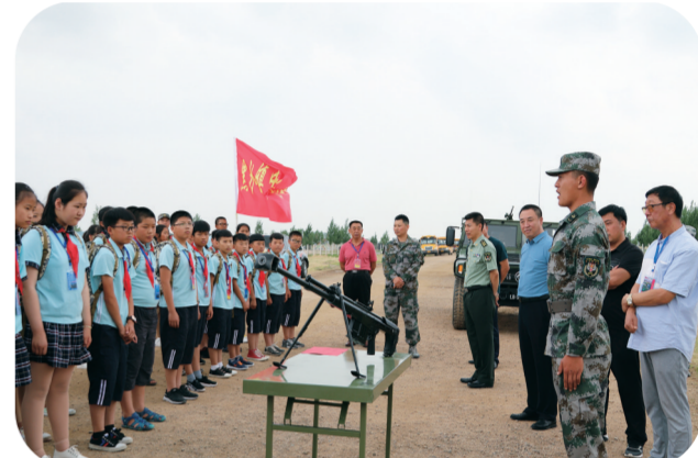
洮南市某部官兵为黑水小学开展军事日活动。