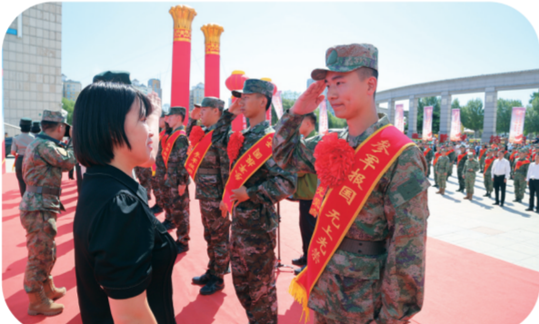
四平市在四平英雄广场举行新兵入伍欢送仪式。

青年强则国强,青年兴则国兴。为筑牢青年一代的理想信念,他们充分发挥四平战役纪念馆、烈士陵园国家爱国主义教育基地作用,在四平籍入伍新兵离乡前、四平驻军新兵到四平后,组织开展“用英雄之光照亮强军之路,将红色基因根植新兵血脉”活动,组织新兵们到纪念馆和烈士陵园等地开展红色文化教育。在大学生入学时,积极为高校新生提供入学军训、党团活动、社会实践活动平台,全方位展示“四战四平”的深刻内涵,培育大学生爱国主义精神。