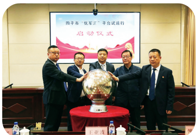
2024年4月25日,四平市举行“优军汇”平台试运行启动仪式。

四平,因“四战四平”而闻名,铭刻下了“为新中国而战”的辉煌印记。英雄是四平市的城市标签,红色是四平的文化底色。