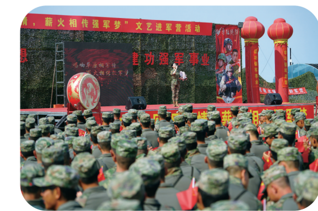
白城市组织文艺工作者慰问演训部队官兵。鲍海明 摄

“军队打胜仗,人民是靠山。”拥军支前永远在路上,白城市将继续发扬拥军支前光荣传统,续写新时代双拥赞歌,唱响军政军民团结和谐壮丽的最强音。