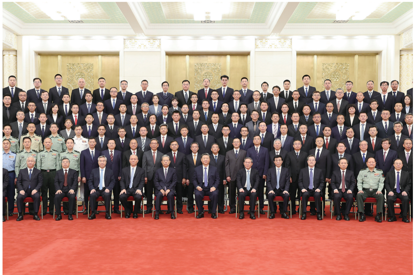
9月23日，党和国家领导人习近平、李强、赵乐际、王沪宁、蔡奇、丁薛祥、李希等在人民大会堂会见探月工程嫦娥六号任务参研参试人员代表并参观月球样品和探月工程成果展览。这是习近平发表重要讲话。