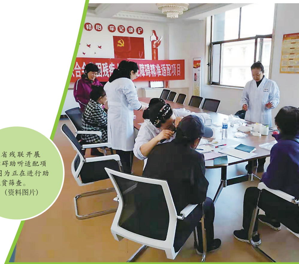
省残联开展无障碍助听适配项目,因为正在进行助听器适配。(资料图片)

为做好困难群众基本生活保障工作,省民政厅下发省级困难群众救助补助资金47.3亿元,保障城乡特困供养对象8.8万人,平均基本生活保障月人均846元和616元;保障城乡低保对象78.7万人,平均保障标准分别达到月人均643元和483元,农村低保标准占城市低保标准的75%,提前完成民政部社会救助“十四五”规划相关要求,困难群众基本生活得到有效保障。