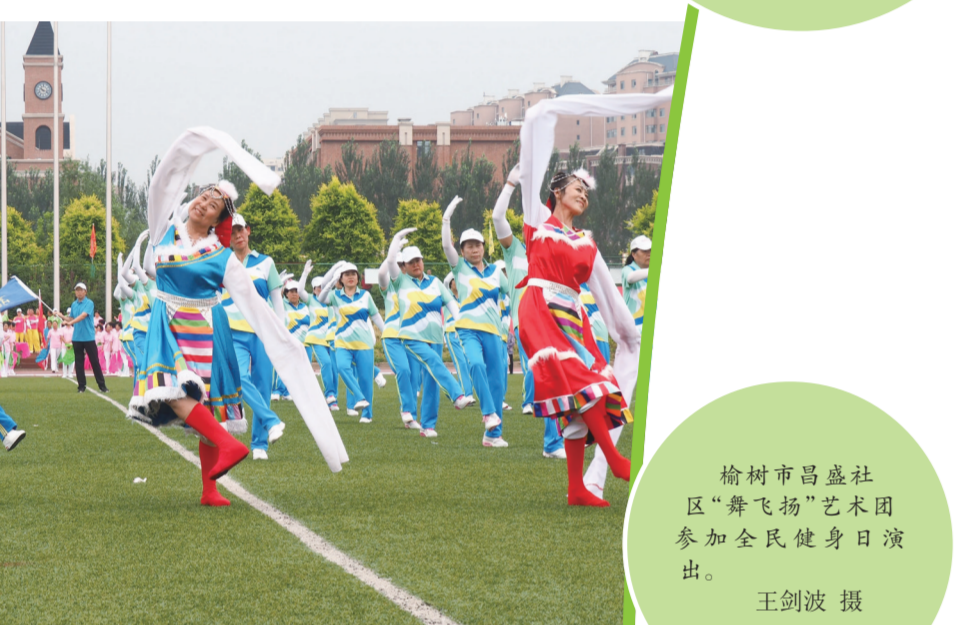
榆树市昌盛社区“舞飞扬”艺术团参加全民健身日活动。