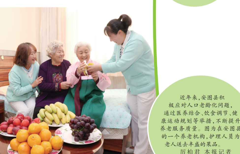
近年来,安图县积极应对人口老龄化问题,通过医养结合、饮食调节、健康运动规划等举措,不断提升养老服务品质。图为在安图县的一个养老机构,护理人员为老人送去丰盛的菜品。