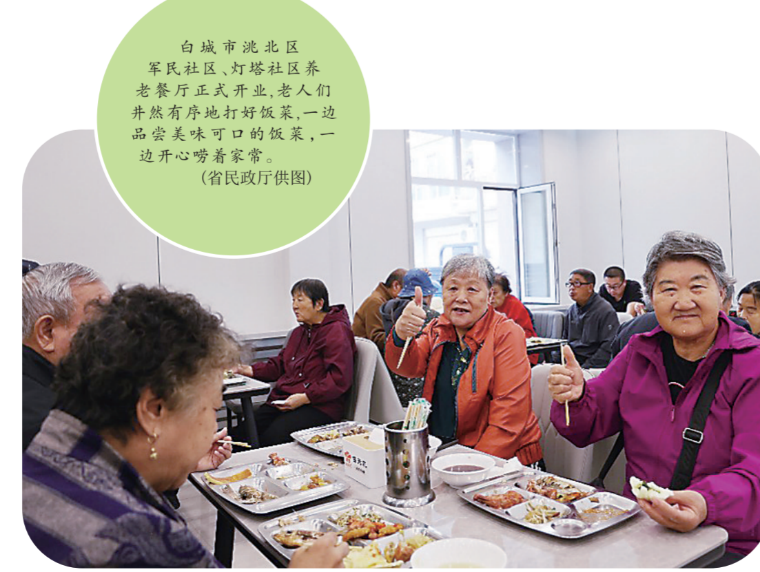
白城市洮北区军民社区、灯塔社区养老餐厅正式开业,老人们井然有序地打好饭菜,一边品尝美味可口的饭菜,一边开心地唠着家常。