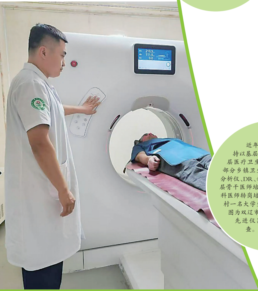
近年来,我省始终坚持以基层为重点,持续加强基层医疗卫生服务能力建设,为大部分乡镇卫生院配备了全自动生化分析仪、DR、彩超等先进医疗设备,基层骨干医师培训、医学定向生培训、全科医师转岗培训等项目全面覆盖;“一村一名大学生村医计划”落地见效。图为双辽市双山镇中心卫生院用先进仪器给病人做CT检查。(资料图片)