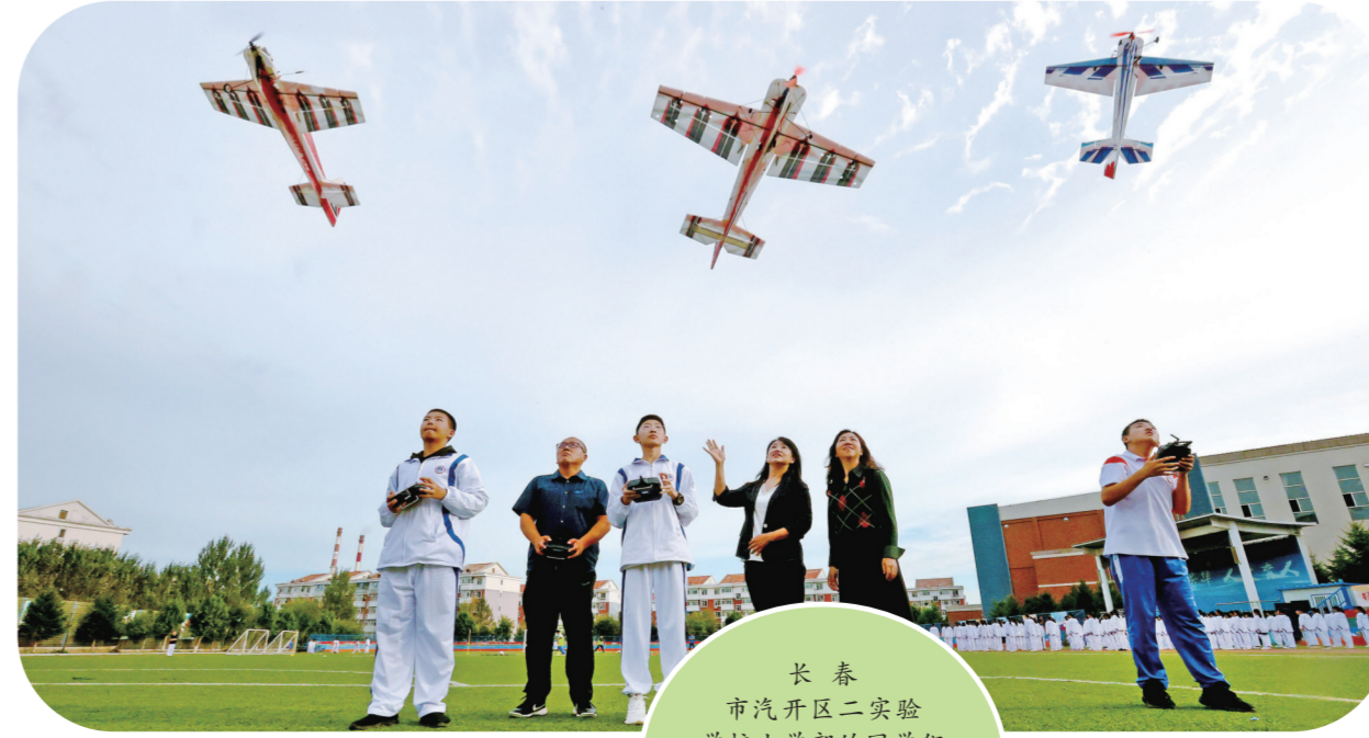
长春市经开区二实验学校小学部的同学们正在参加航模社团的活动。(资料图片)

保障和改善民生没有终点,只有连续不断的新起点。我们相信,全省上下勠力同心,坚持在发展中保障和改善民生,既立足当前,又放眼长远,以实实在在的工作成效回应民生关切,就一定能在吉林全面振兴取得新突破的新篇章上印牢幸福底色、汇聚磅礴力量,共同创造出更加美好的未来。