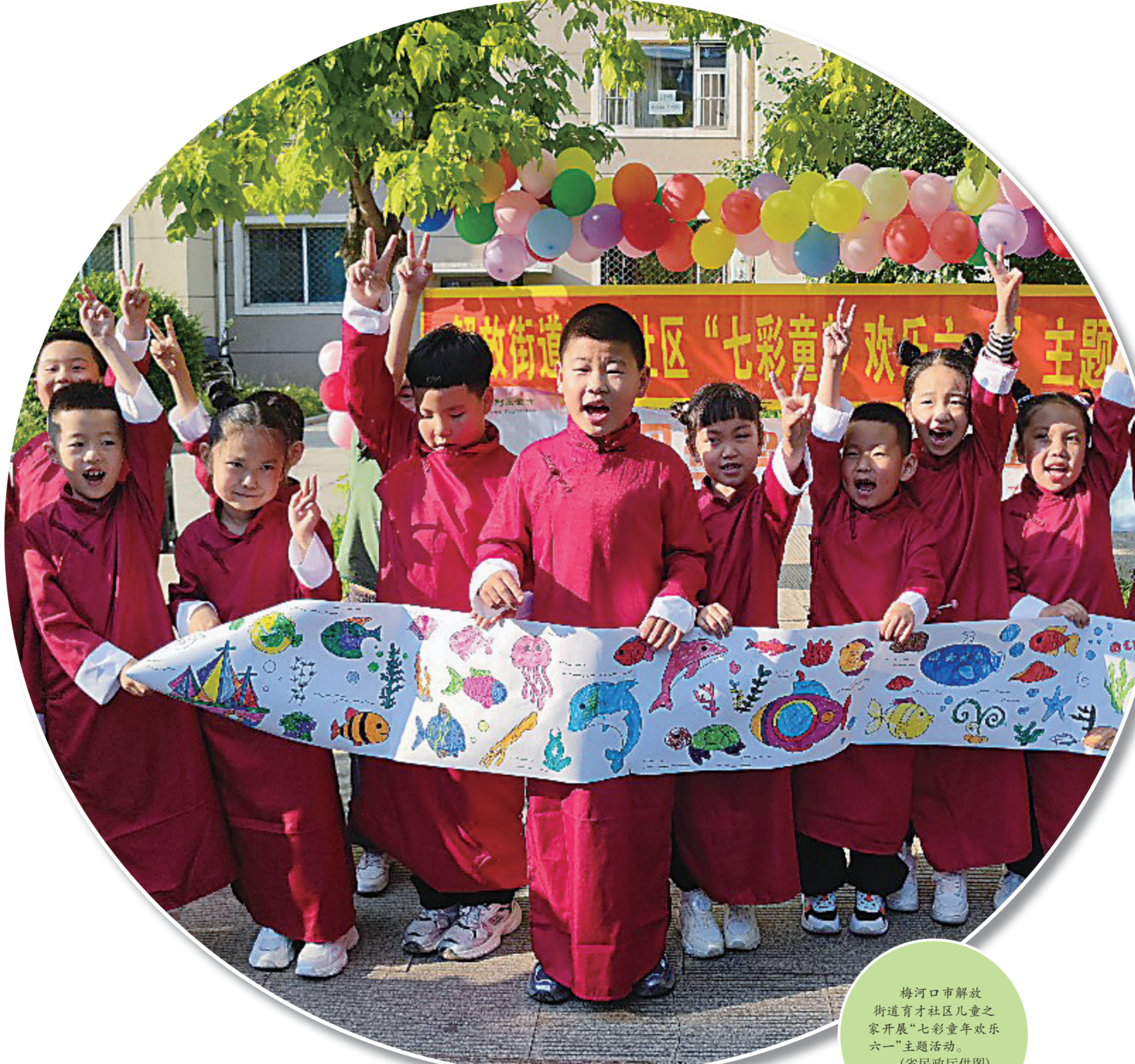
梅河口市解放街道育才社区儿童之家开展“七彩童年欢乐六一”主题活动。