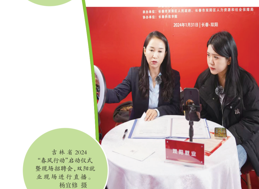
吉林省2024“春风行动”启动仪式暨现场招聘会,双阳就业现场进行直播。