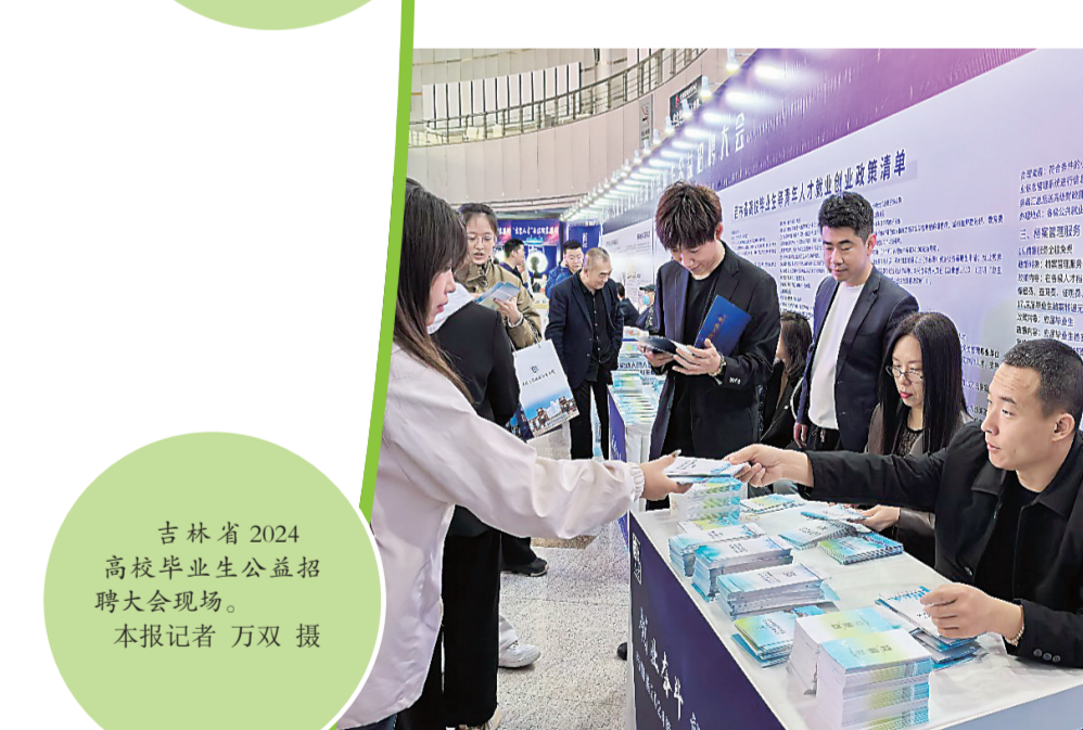
吉林省2024高校毕业生公益招聘会现场。