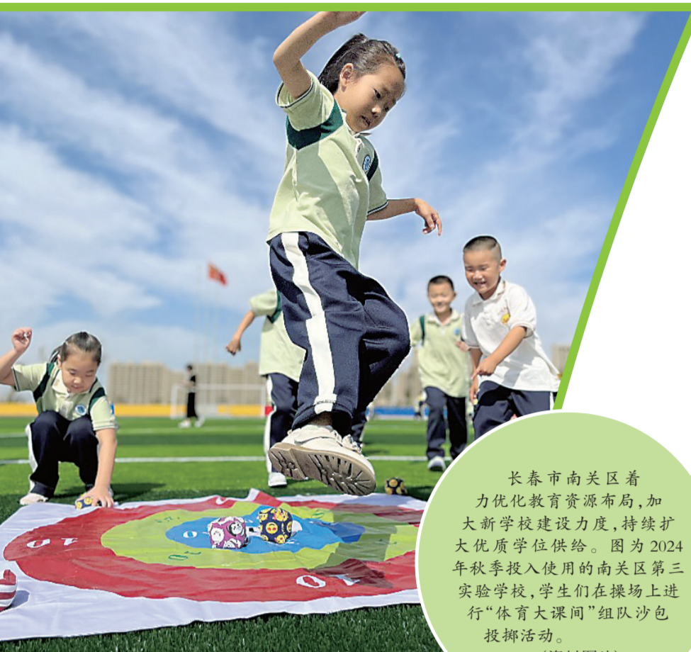
长春市南关区着力优化教育资源布局,加大新学校建设力度,持续扩大优质学位供给。图为2024年秋季投入使用的南关区第三实验学校,学生们在操场上进行“体育大课间”团体队操活动。(资料图片)

吉林市船营区德胜街道西大社区一家低保户,户主和妻子都有不同程度的残疾,女儿是一名小学生。据社区工作人员介绍,提高保障标准后,他们家每月基本生活保障金1980元,增发补助金1020元,残疾人两项补贴每月340元。同时,将该家庭纳入吉林市低收入人口动态监测范围,通过减免冬季取暖费、女儿在校期间午餐费等,给予分类专项救助,有效缓解了该家庭的实际困难。