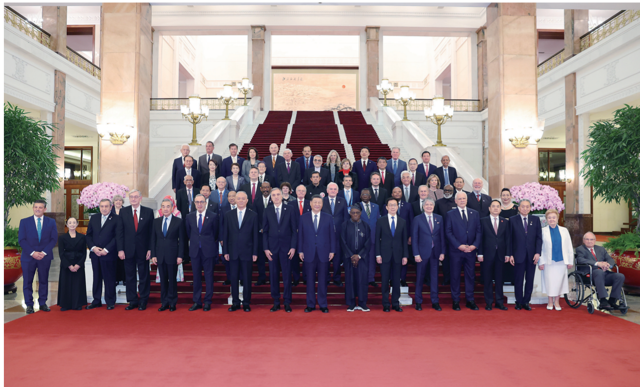
10月11日上午,国家主席习近平在北京人民大会堂集体会见出席中国国际友好大会暨中国人民对外友好协会成立70周年纪念活动的外方嘉宾。这是习近平同部分外方嘉宾代表合影留念。

新华社北京10月11日电(记者孙奕 温馨)10月11日上午,国家主席习近平在北京人民大会堂集体会见出席中国国际友好大会暨中国人民对外友好协会成立70周年纪念活动的外方嘉宾。(讲话全文见第二版)