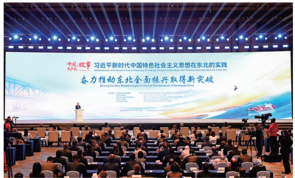
10月14日,由中共中央对外联络部和中共内蒙古自治区党委、辽宁省委、吉林省委、黑龙江省委共同主办的“中国共产党的故事——习近平新时代中国特色社会主义思想在东北的实践”专题宣介会在吉林省长春市举行。本报记者 张野 摄

与会外宾热烈祝贺中华人民共和国成立75周年,高度评价新时代以来中国经济社会发展取得的巨大成就和中国为世界发展所作的积极贡献,表示通过见证中国东北地区的发展,增强了对中国经济发展前景的信心,习近平总书记提出的新发展理念不仅对中国具有重大指导意义,对世界其他国家尤其是广大发展中国家也具有重要的借鉴价值。将认真学习借鉴中国共产党推动区域协调发展的经验,通过观念创新和方法创新,推动传统工业转型,努力培育新兴产业,实现可持续发展,推进符合本国国情的现代化道路。