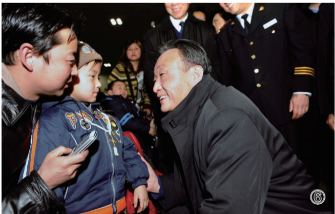
⑥2008年2月3日，吴邦国同志在北京西站候车室与旅客交谈。