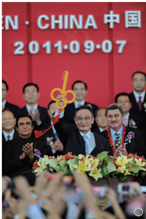
⑨2011年9月7日，吴邦国同志在福建厦门出席第十五届中国国际投资贸易洽谈会开幕式。