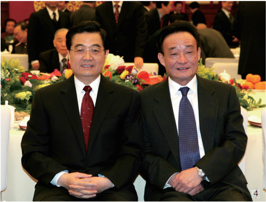
④2005年1月1日，全国政协在北京举行新年茶话会。这是胡锦涛同志与吴邦国同志在一起。