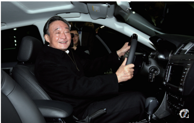
⑦2010年1月30日，吴邦国同志在上海汽车集团股份有限公司技术中心察看新能源样车。新华社记者 姚大伟 摄