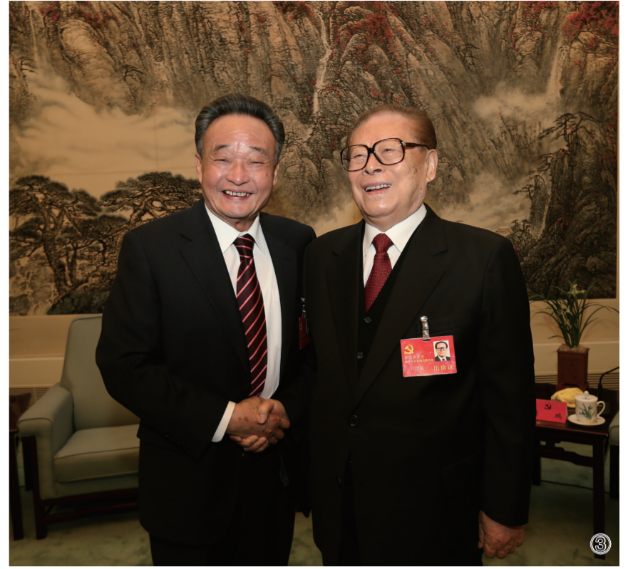
③2012年11月14日，中国共产党第十八次全国代表大会在北京闭幕。这是闭幕会前，江泽民同志与吴邦国同志在一起。新华社记者 兰红光 摄