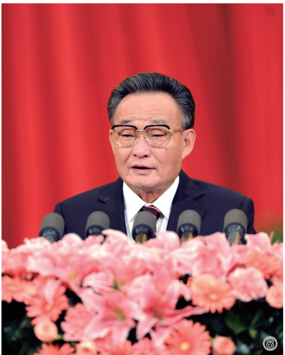
⑧2011年3月10日，十一届全国人大四次会议在北京人民大会堂举行第二次全体会议。吴邦国同志作全国人大常委会工作报告。