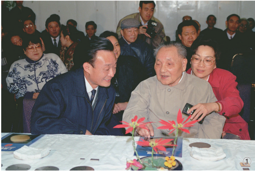
①1992年2月10日，邓小平同志在上海贝岭微电子制造有限公司参观时与吴邦国同志交谈。