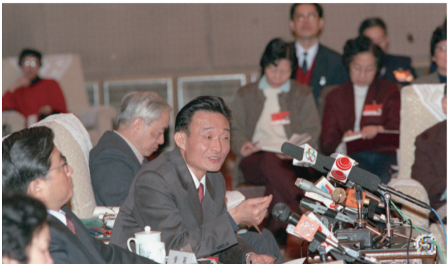
⑤1994年3月，时任上海市委书记的吴邦国同志在全国两会上海代表团全团会议上。