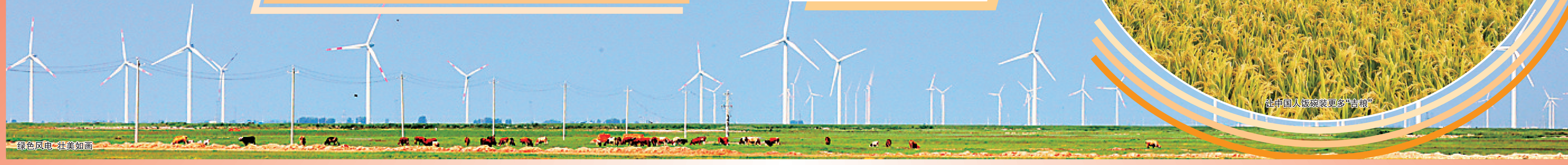
绿色风电 壮美如画