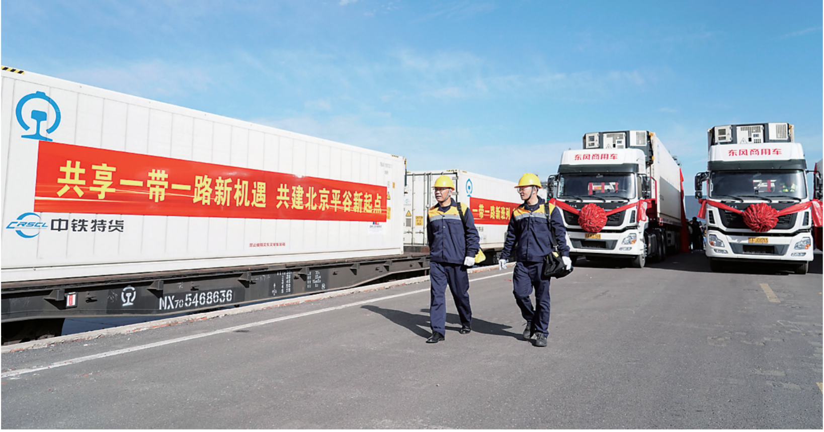
10月20日，中老铁路(万象—昆明—北京·平谷)国际冷链专列停靠在北京市平谷区京平综合物流枢纽。当日，首趟中老铁路(万象—昆明—北京·平谷)国际冷链专列暨“京滇·澜湄线”抵达北京市平谷区京平综合物流枢纽，首发接车仪式同期举行。据了解，本趟国际货运班列10月12日从老挝万象南站驶出，运载着产自老挝的390吨优质香蕉，由磨憨口岸入境，通过全程冷链运输抵达北京。