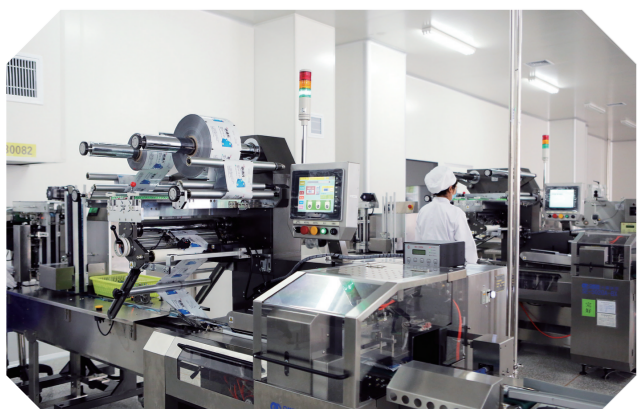
吉林万通药业生产线。