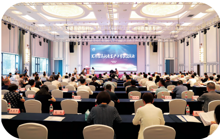
“发展医药新质生产力院士专家通化行”活动。