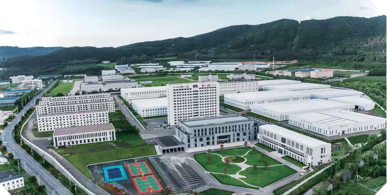
修正通化正源药业数字化制药与儿药宝宝乐等重大药物建设项目。

立“通化市法律服务和劳动关系委员会”,帮助民营企业完善治理结构、防范法律风险、化解矛盾纠纷,促进民营企业守法诚信经营。