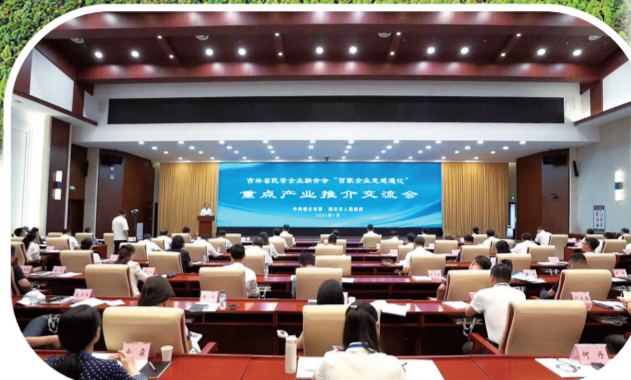
“百家企业走进通化”重点产业推介交流会。