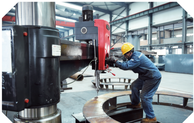
在通化建新科技有限公司生产车间,工人们正加紧赶制订单。