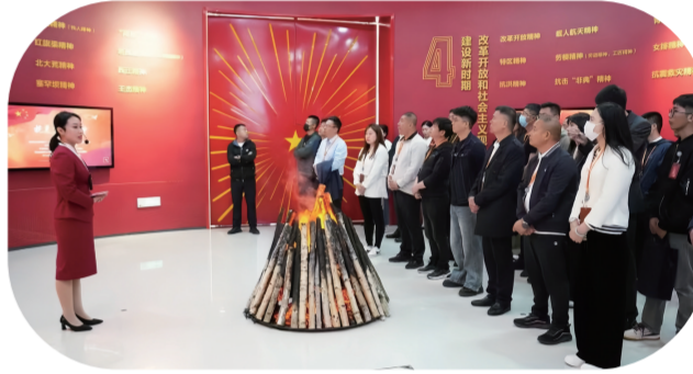
吉林省年轻一代民营企业企业家坚定理想信念专题培训班在吉林杨靖宇干部学院举办。