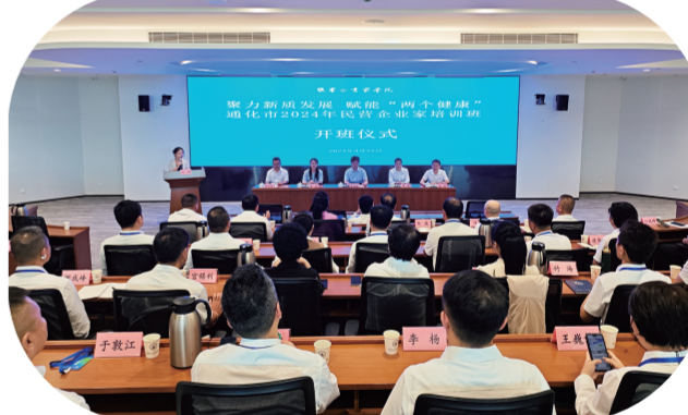
赴张寨企业家学院举办通化市民营企业家培训班。