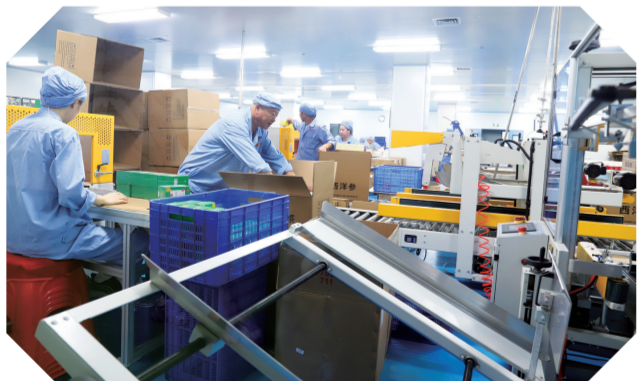
东方红西洋参药业(通化)股份有限公司连续三年实现产值10亿元以上。