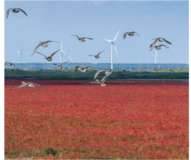
10月29日，鸟类飞过江苏省盐城市东台条子泥湿地(无人机照片)。入秋以来，江苏省盐城市东台条子泥湿地北端的5000余亩盐蒿草红遍海滩，犹如“红毯”，美景如画。