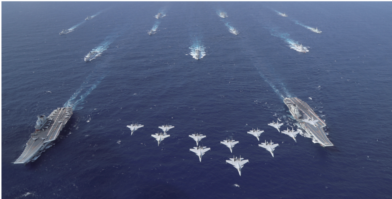
10月下旬，海军辽宁舰编队开展远海实战化训练。期间，辽宁舰、山东舰编队首次开展双航母编队演练。