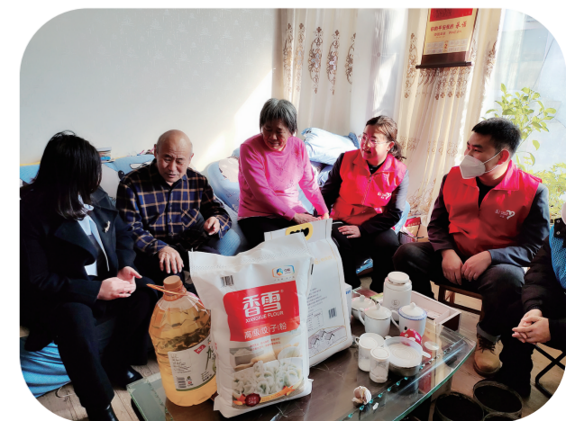
党员志愿者慰问孤寡老人。(资料图片)