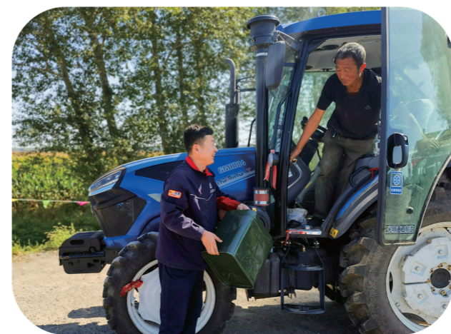
为秋收农户送油。(资料图片)