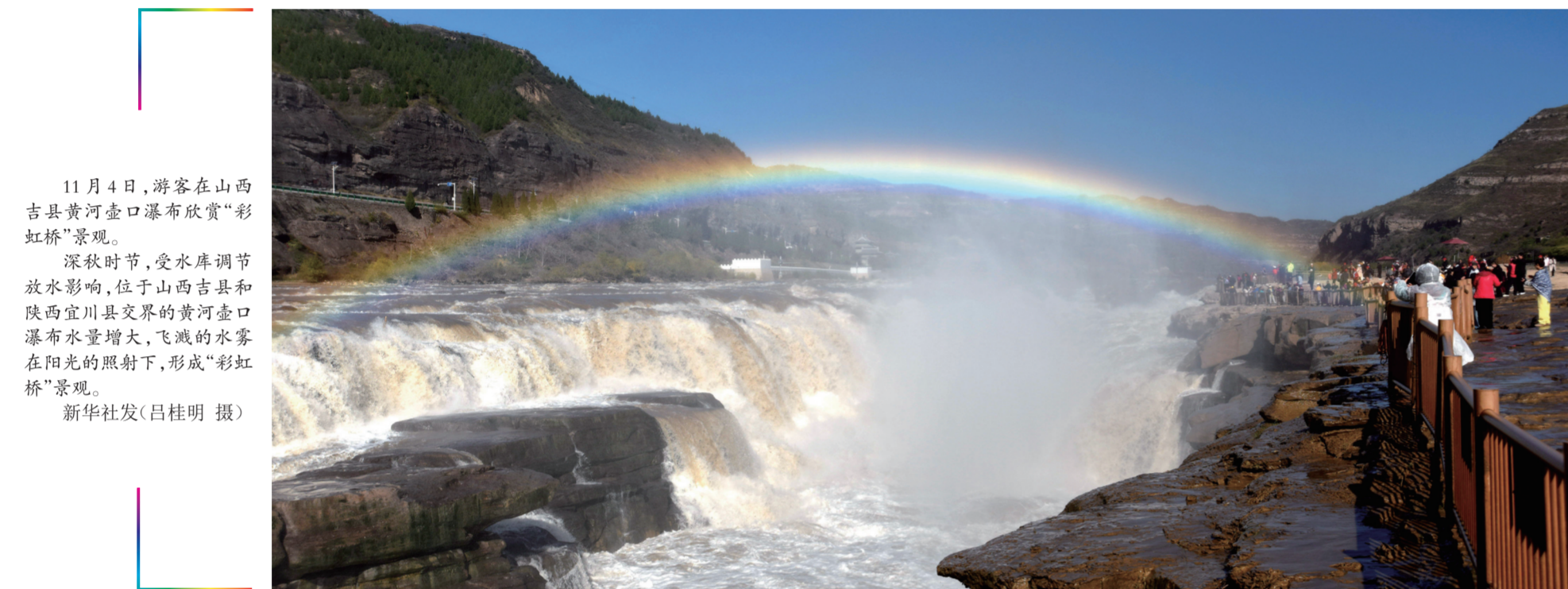
11月4日,游客在山西吉县黄河壶口瀑布欣赏“彩虹桥”景观。