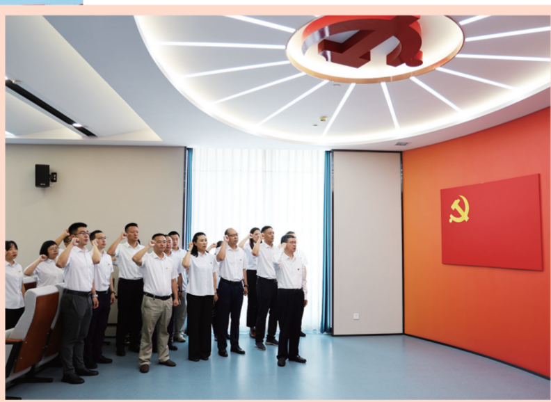
党员参观廉政教育基地。(资料图片)

坚持配合推动市场整治,有力整治市场乱象,竞争环境逐步趋向理性。精准研判市场、资源及考核政策走向,实现资源运作创效。聚焦效益、服务、运营和管理四大提升,构建以汽油增量创效为主线,单位客户开发维系为基础,营销策划与运营并重的营销体系,全渠道会员客户数量不断提升。柴油方面加强行业协作,共同维护市场,稳步增量创效。天然气依托上下游一体化优势开展代加工合作,提高天然气