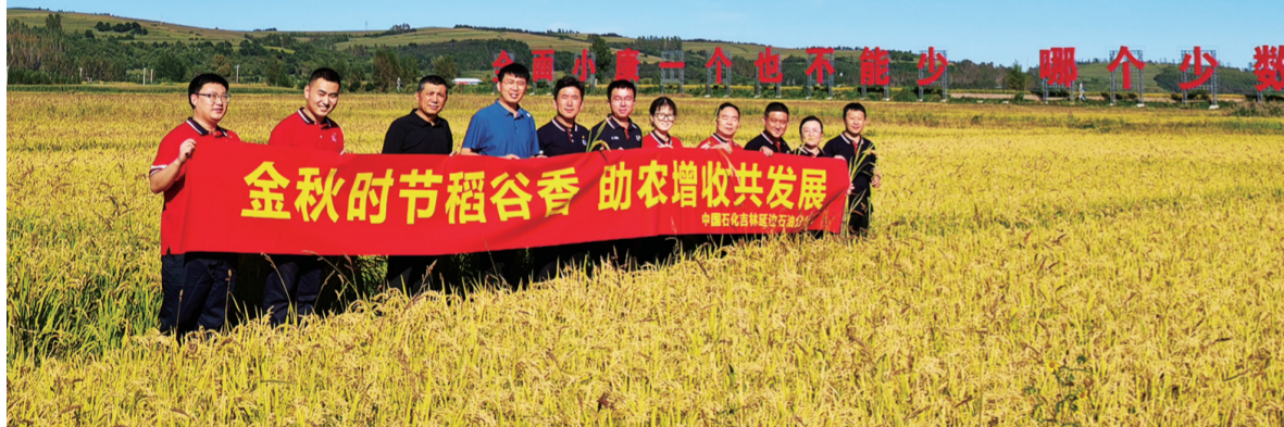
志愿者帮助农民收割水稻。

中国石化销售股份有限公司吉林石油分公司(以下简称中国石化吉林石油)是中国石化集团在吉林省设立的销售企业,是吉林省成品油、天然气主要供应商,按照中国石化管理体制调整要求于2009年12月重组成立,主营汽柴油、天然气批发零售、便利店经营、充换电等业务,近年来,适应市场变化加快向“油气氢电服”综合能源服务商转型发展。中国石化吉林石油致力于为吉林人民提供清洁能源和优质服务,让“能源至净,生活至美”的品牌承诺更加深入人心,使中国石化“党和人民好企业”的形象走进千家万户。