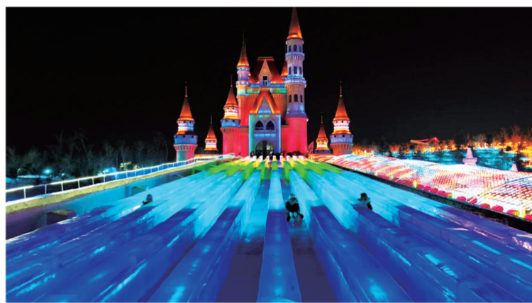
上雪季,长春冰雪新天地热闹非凡。