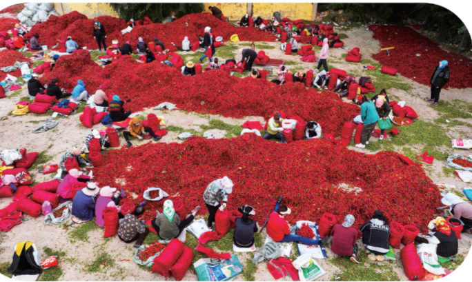
福顺镇农民挑选辣椒。