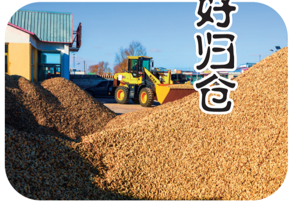
蛟流河乡粮食购销点收购的花生正在进行筛选。