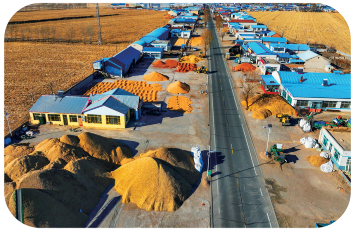
蛟流河乡发挥地理优势形成粮食集中购销地，图为昌盛村街道两侧正在整理和晾晒粮食。