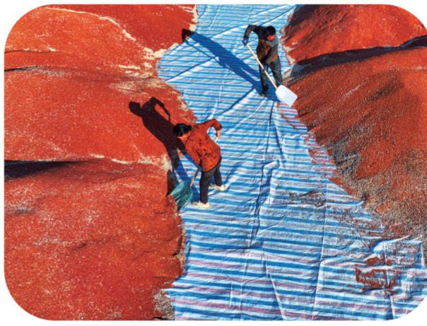
蛟流河乡发挥地理优势形成粮食集中购销地，图为昌盛村街道两侧正在整理和晾晒粮食。

“实施‘2+1’党建工作共建模式以来，无论是社区、行管部门，还是我们党支部自身都有了更明确的方向。