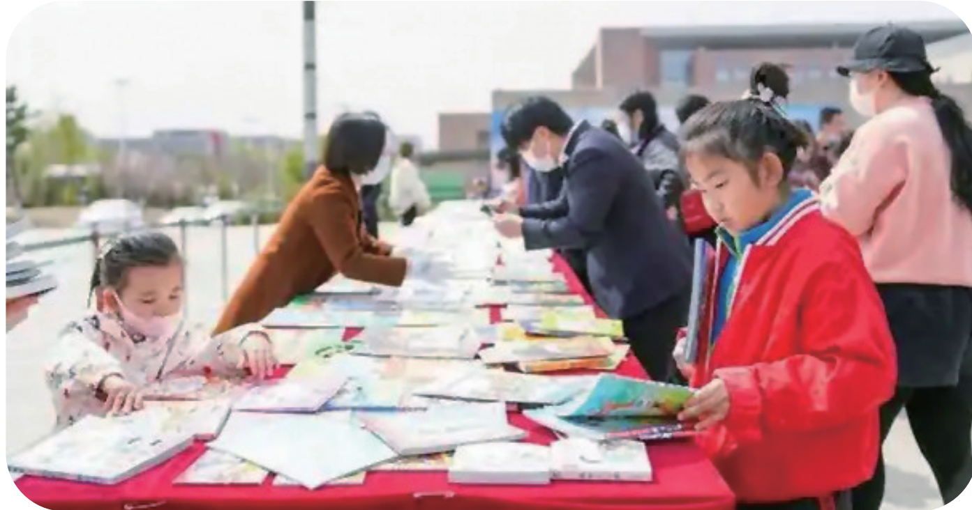
省图书馆举办换书大集

次金铂老师的主题演讲，让我了解了怎样才是科学的减压方式，并不是我之前理解的找朋友聚一聚吃个饭就是减压了，而是要通过合理的运动、调整作息等才能有效减压。”