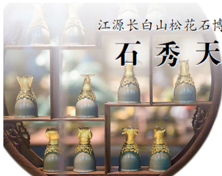
松花石文创产品十二生肖酒具。