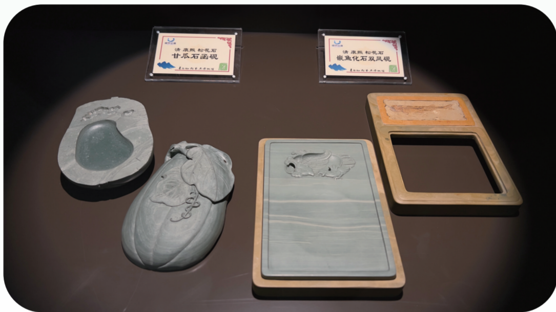
白山市江源长白山松花石博物馆内展示的松花石砚砚仿制品。

正如吉林大学东北振兴发展研究院院长、教授邢正所说,“文化要传承,既要有群众性,也要有专业性,没有群众性就没有根基,没有专业性就无法出精品,群众性和专业性的结合才能保持文化的持久活力,挖掘出深厚的文化积淀,让我们的古老文化重新大放光彩。”从山间顽石到文房重器,再到人人可享的文旅产品,松花石的蜕变,是自然与人文的和鸣,是时间与匠心的礼赞,是吉林大地诗意美丽的回响。这方瑰宝,倾听着白山松水的千年低语,感受着跨越时空的墨香与传承。蘸一笔浓墨,道不尽它的奇、秀、美,松花石所呈现的文化、内涵、价值,在彼时,亦在将来。