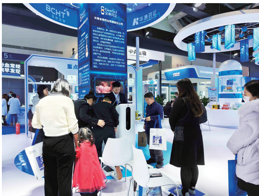
2024长春健博会上，金赛药业开展足底扫描健康筛查。

连日来，在2024长春国际医药健康产业博览会上，长春新区展区人头攒动，金赛药业旗下品牌赛优姿EX11体态检测系统、3D足底扫描仪等医疗器械吸引了众多消费者、客商争相体验。