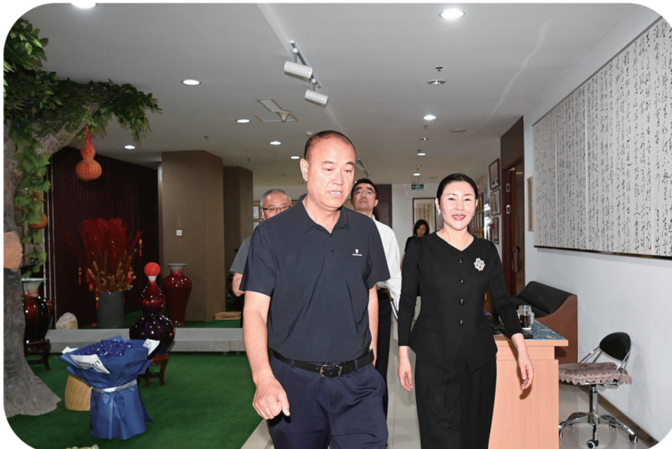
朝阳区人大代表调研吉林省寰旗科技股份有限公司。

市科技创新条例、农村集体土地适度规模化经营试点、城镇老旧小区改造项目、提升文明城管水平、创建无废园区、加强危化品企业应急处置能力等工作开展专项视察，督促补短板、堵漏洞、强弱项，助力百姓生活品质改善提升。 促进社会公平正义。审议2023年度法治政府建设工作报告，推动法治政府建设不断深入。听取审议区人民检察院关于开展未成年人综合保护工作情况的报告，视察朝阳区交通治堵和交警大队窗口服务工作，进一步促进依法行政、公正司法。听取审议2023年度规范性文件备案审查工作情况报告，切实做好规范性文件备案审查工作。加强人大信访工作，依法依规办理信访事项23件。