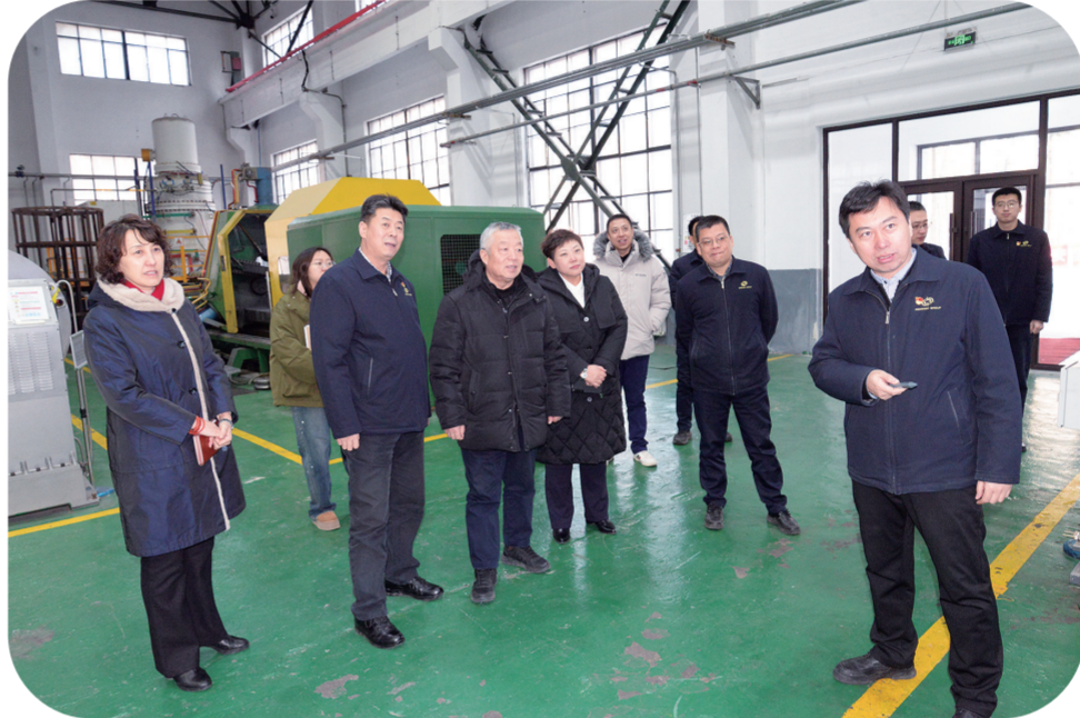
朝阳区人大代表调研走访某研究所。

参与，全年邀请170余名代表列席会议，参与视察、调研等工作，为代表履职创造条件。充分发挥代表参与决策、监督推动和桥梁纽带作用，组织人大代表200余人次参加“一府两委两院”相关活动，保障代表知情知政。进一步完善代表履职评价机制，建好履职档案，组织市、区代表回选区年度述职，促进代表依法履职。坚持常委会班子成员联系代表机制，灵活开展“双联系”活动，走访、电话联系人大代表96人，听取意见建议，拓展了联系深度，增强了联系实效。 注重完善代表履职平台。坚持区人大代表家站室“1+N+X”特色架构，重点打造“代表家站+6N”模式，持续推进代表家站建设，落实代表进站站制度，提高代表家站工作水平，优化代表家站功能，全面提升代表家站运行质量。不断完善代表联络站建设，做到村和社区全覆盖，打通代表