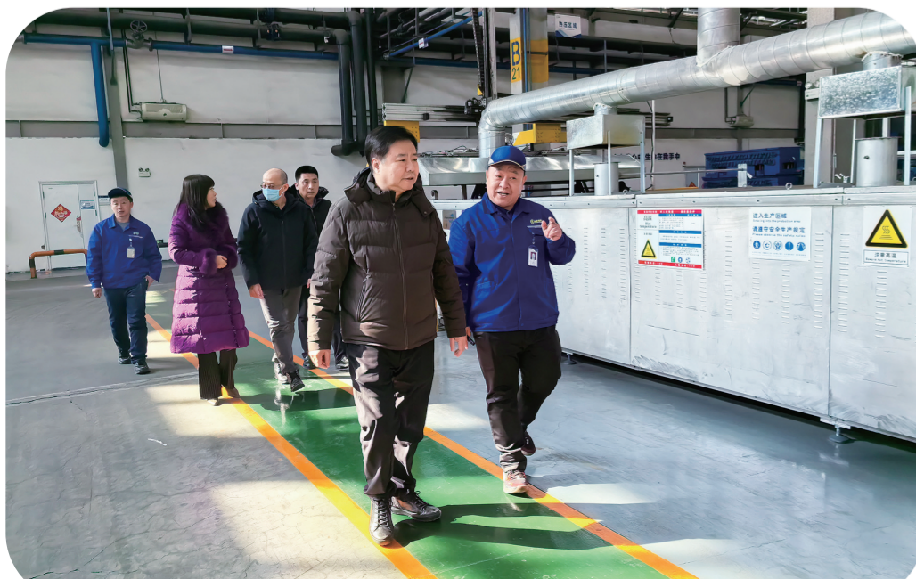
朝阳区人大代表调研走访长春泰利汽车零部件有限公司。

打铁还需自身硬。紧扣“四个机关”新定位新要求，全面加强自身建设是做好新时代人大工作的重要保证。 这一年，长春市朝阳区人大常委会聚焦新定位新目标，把加强自身建设作为夯实人大工作基础、提高履职能力的重要内容，努力打造让党放心、让人民群众满意的政治机关、权力机关、工作机关和代表机关。 强化政治建设。深入学习领会党的二十届三中全会精神、习近平总书记关于东北全面振兴和吉林工作的系列重要讲话重要指示精神，开展系统化、分层次、全覆盖培训，切实用党的创新理论武装头脑、指导实践、推动工作。认真落实管党治党主体责任，加强机关党建标准化建设，高质量完成机关党支部、工会换届工作，开展“我为群众办实事”活动，严肃党内政治生活，干部思想政治素质明显提高，人大工作整体实效明显提升。 强化制度建设。修订代表大会议事规则、常委会议事规则、常委会组成人员守则，将坚持党的领导、上位法最新规定和行之有效的实践经验写入条文。完善主任会议议事规则和代表大会、常委会会议、主任会议工作程序，对区人大常委会各委办职责进行梳理、调整完善，增强了机关工作整体合力。新制定、修改机关规章制度30余项，并汇编成册，确保工作有规范、流程有模板、执行有标准，有力保障机关工作务实高效运行。 强化作风建设。深入贯彻落实省委“崇尚实干”和市委“八个表率”要求，牢固树立和践行正确政绩观，认真贯彻落实《整治形式主义为基层减负若干规定》，以务实重行的好作风，打造“落实型人大”。切实加强对人街道工委的领导，常委会班子成员分工联系人大街道工委，定期参加和指导人大街道工委活动，总结推广基层人大工作经验和创新成果，不断增强全区人大工作的整体实效。加强对两镇人大主席团工作的业务指导，规范镇人大建设，两镇人大工作呈现基础扎实、制度健全、职责明确、工作规范的良好态势。加强机关文化建设，组织各类文体活动，营造快乐工作、健康生活的浓厚氛围。 回首过往，足印坚实，展望未来，任重道远。新时代新征程呼唤新作为，新使命新任务激发新担当。