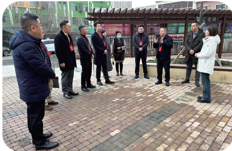
朝阳区人大代表开展“实地献策互动会”，为基层解难纾困。

联系群众的“最后一公里”。重庆街道光明社区代表联络站“小圆桌”撬动“大民生”经验做法，以及北安社区代表联络站“红帮手”维修队为群众解难题事迹，清和街道“人大代表进社区，法治相约”和湖西街道“代表送法进军营”主题活动被国家和省、市等多家媒体宣传。老挝人民革命党高级干部考察团、重庆市、青海省人大常委会先后到光明社区代表联络站、永昌街道代表之家考察