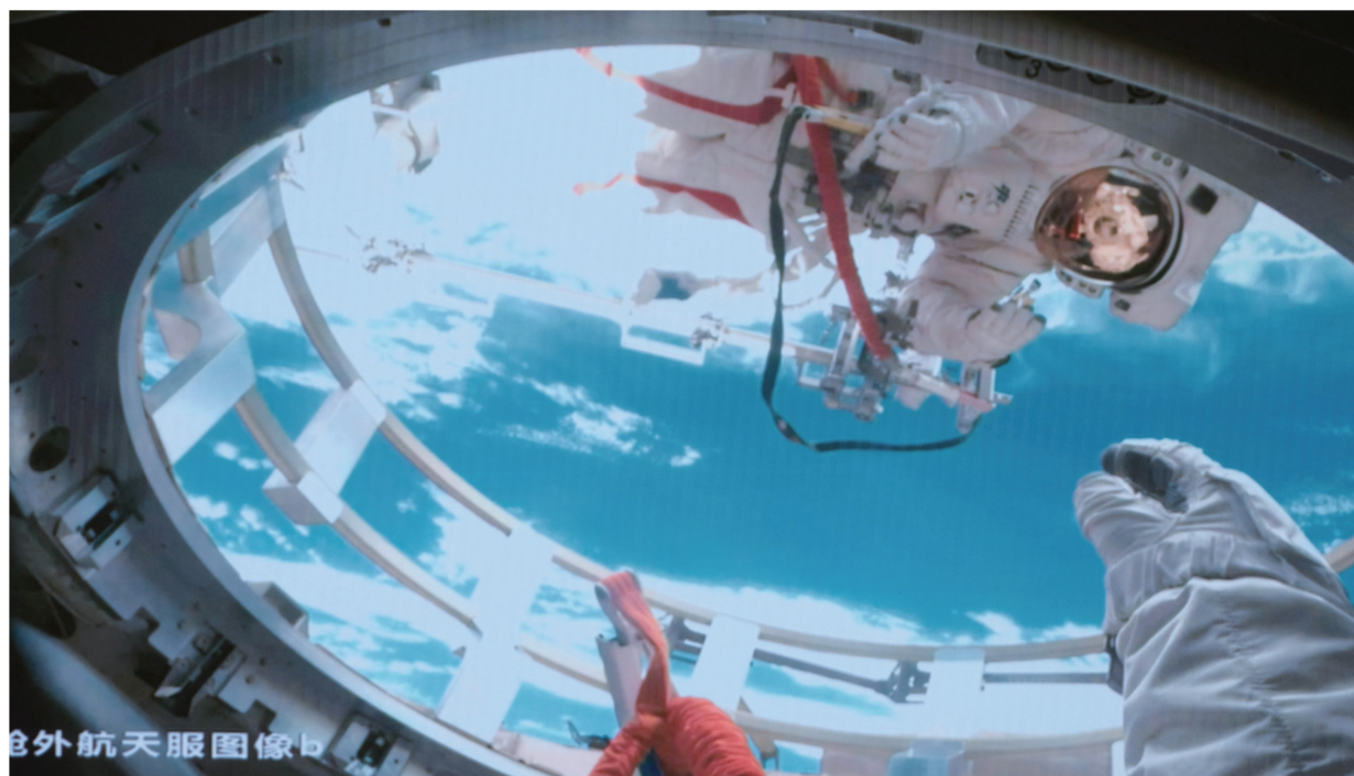
12月17日在北京航天飞行控制中心拍摄的神舟十九号航天员蔡旭哲(上)、宋令东(下)在气闸舱舱门内外工作的画面。

随着最新过境免签政策落地,欢迎更多外国朋友来这里体验“city不city”,遇见中国的更多美好。(新华社北京12月17日电)