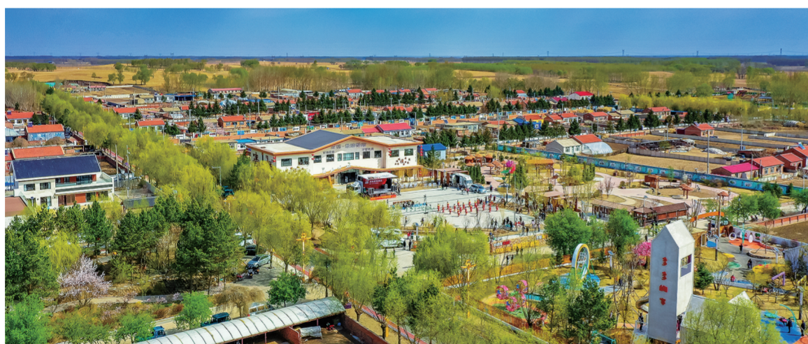
双辽市百禄村乐活小镇俯瞰。张树明 航拍(资料图片)

双辽市在推进乡村全面振兴工作中,以确保不发生规模性返贫为底线,全面提升乡村发展水平、建设水平、治理水平,把一幅幅“大写意”,变为可圈可点的“实景图”。