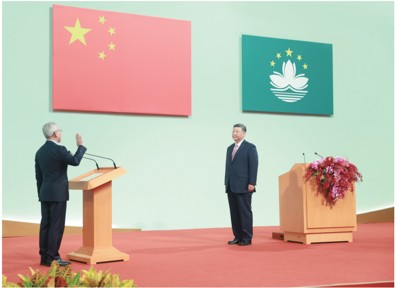
12月20日上午,庆祝澳门回归祖国25周年大会暨澳门特别行政区第六届政府就职典礼在澳门东亚运动会体育馆隆重举行。中共中央总书记、国家主席、中央军委主席习近平出席并发表重要讲话。这是习近平监誓,澳门特别行政区第六任行政长官岑浩辉宣誓就职。