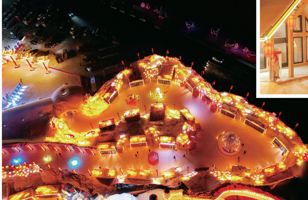
▼夜色中的查干湖更加绚丽多姿,花灯前,游客纷纷驻足打卡留念。

12月28日,吉林查干湖第23届冰雪渔猎文化旅游节盛大开幕,吸引了来自世界各地的游客。流传千年的传统捕鱼技艺,文旅融合的冰雪场景和精彩活动,让来到开幕式现场的游客赏目、赏心又尽享口福,热闹嗨玩了一天,很多人夜色已深还不舍离去。