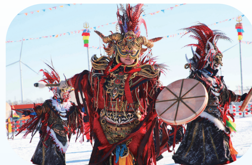
神奇、神秘的祭湖、醒网仪式。