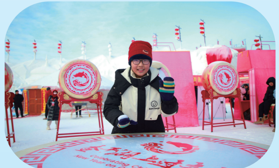
游客用力敲打写有“查干湖上过大年”的大鼓,传递欢快喜悦的心情。