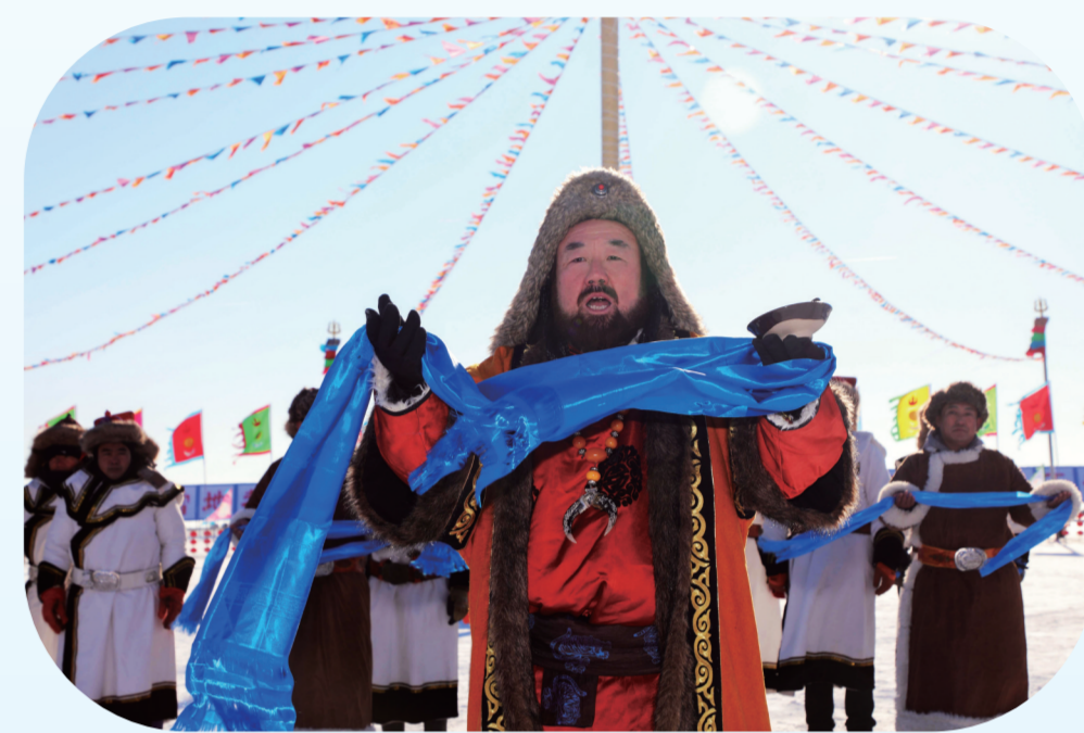
游客在鱼球前拍照留念,祝愿自己生活年年有余。