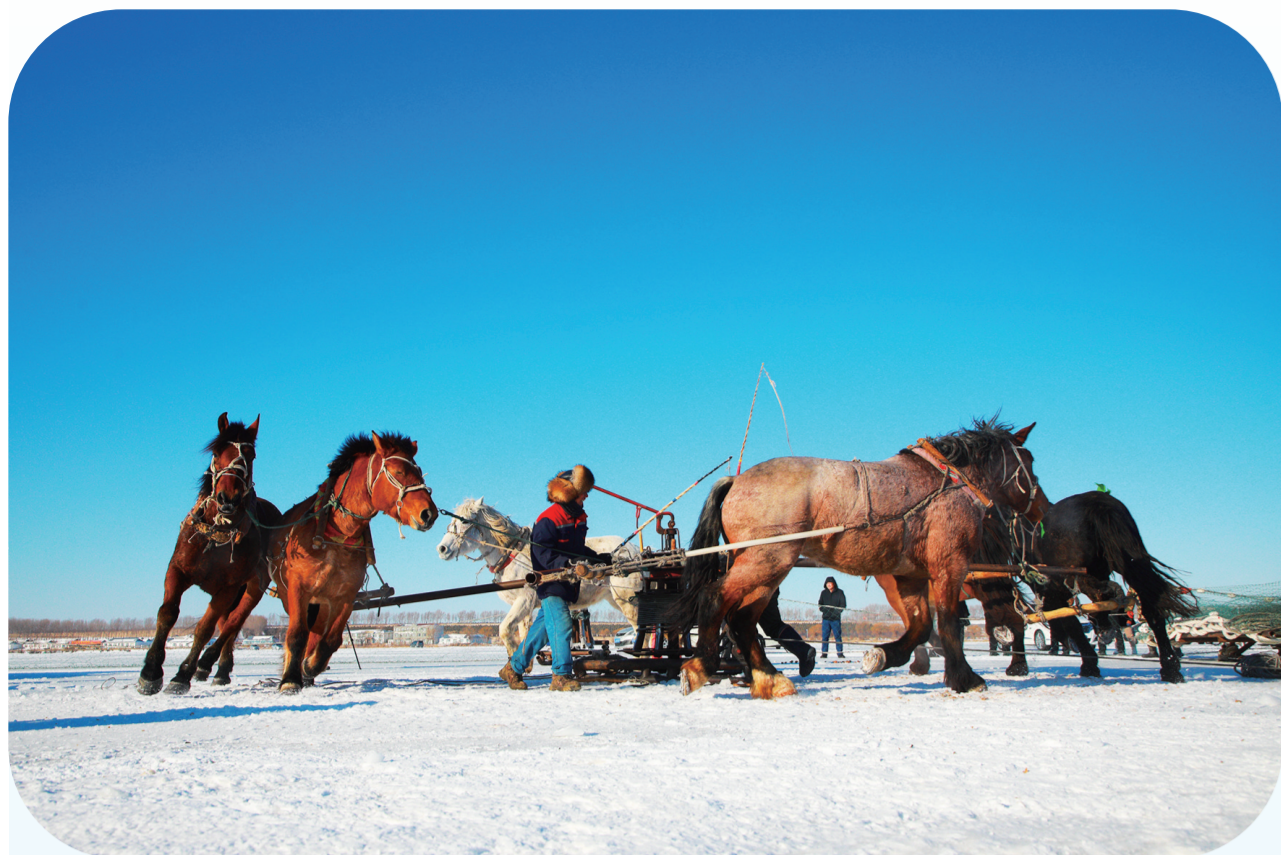
传承千年的马拉拉盘式下网捕鱼方式,让游客耳目一新,充满好奇与震撼。