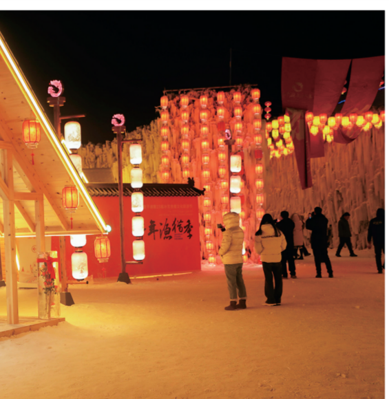
▲龙鱼部落内各项冰雪景观场景和小品各具特色,让人流连,这是部落内的龙鱼客栈。