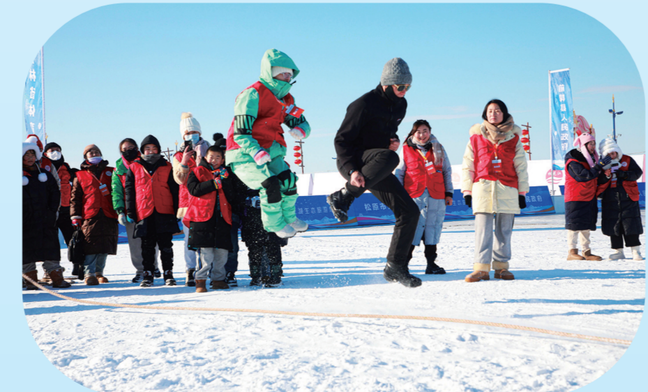
很多传统的运动、游戏被搬到冰面上,让游客体会到了别样的乐趣。

2023年冬季,查干湖不仅以其独特的冰雪文化吸引了无数游客的目光,更以其强劲的“吸金”能力展示了在旅游业中的卓越表现,累计接待游客141.73万人次,同比增长229.92%,并创造了12.47亿元的旅游综合收入,刷新了历史纪录。这不仅证明了查干湖的魅力,也彰显了其在推动地方经济发展中的重要作用。