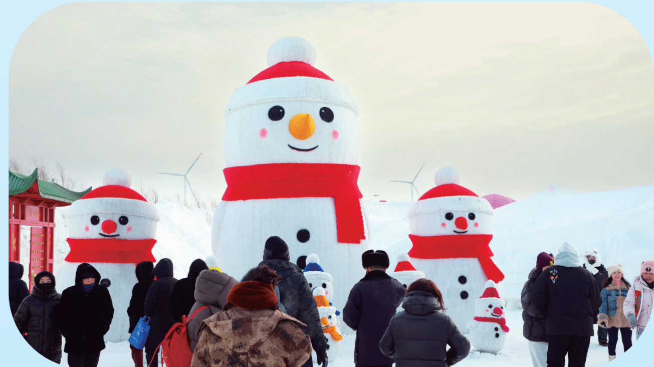
俏皮可爱的雪雕深受儿童喜爱。