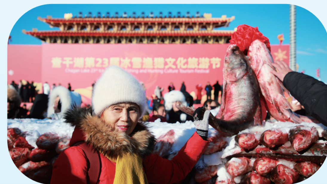
游客在鱼球前拍照留念,祝愿自己生活年年有余。