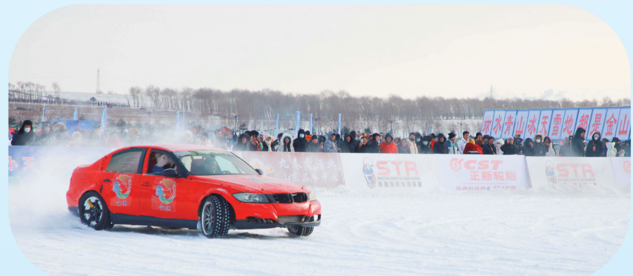
惊险刺激的冰上漂移是年轻人的热爱,图为专业赛车手在进行表演。