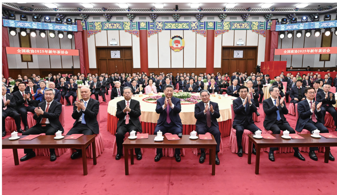
12月31日，全国政协在北京举行新年茶话会。党和国家领导人习近平、李强、赵乐际、王沪宁、蔡奇、丁薛祥、李希、韩正出席茶话会并观看演出。

新华社北京12月31日电 中国人民政治协商会议全国委员会12月31日上午在全国政协礼堂举行新年茶话会。党和国家领导人习近平、李强、赵乐际、王沪宁、蔡奇、丁薛祥、李希、韩正