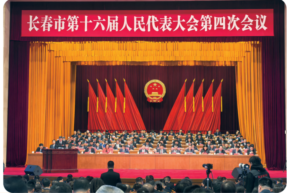
1月8日,长春市第十六届人民代表大会第四次会议开幕。

2025年,长春将扎实推动高质量发展,进一步全面深化改革,扩大高水平对外开放,不断提高人民生活水平,保持社会和谐稳定,高质量完成“十四五”规划目标任务,为实现“十五五”良好开局打好基础。