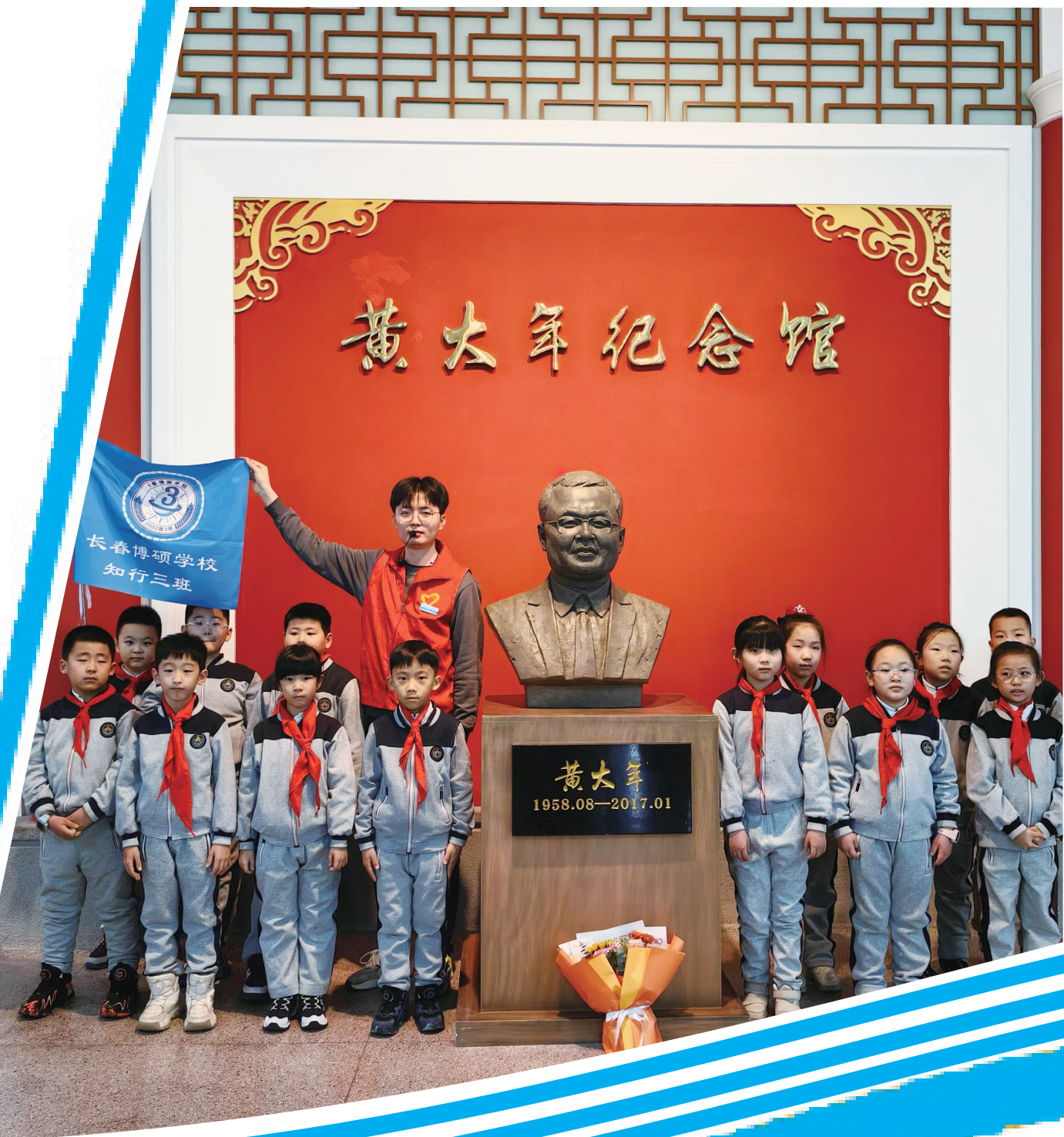
中小学生在吉林大学黄大年纪念馆开展研学活动。