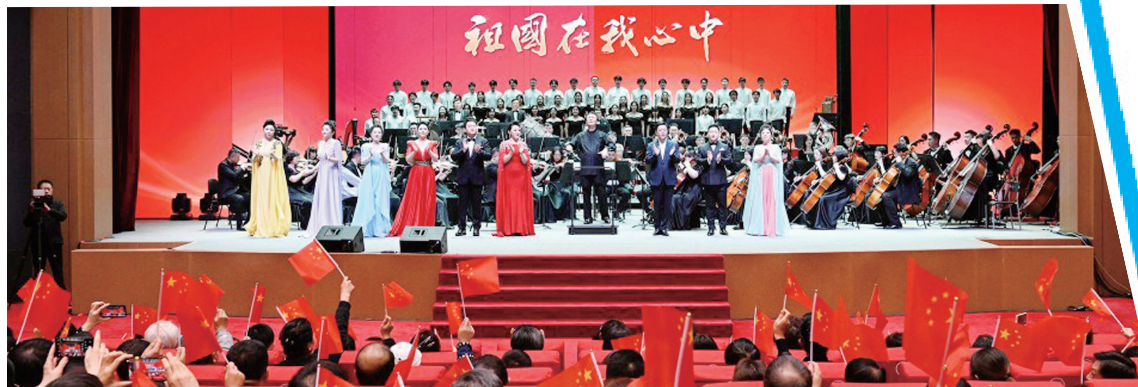
纪念新中国成立75周年“祖国在我心中”交响音乐会现场。