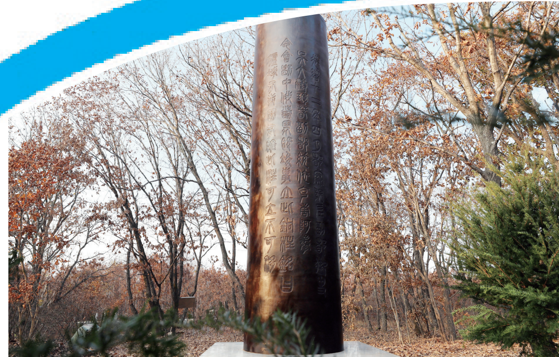
我省举行“吴大澂收复国土纪念”揭牌仪式,重铸铜柱。