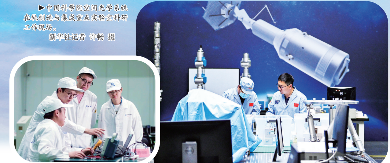
长春卫星研发中心。

近年来,长春发展进程的每一个断面都留下了科技创新的发展印记,一个个创新领域的新动能,为新质生产力发展做出生动的注脚。