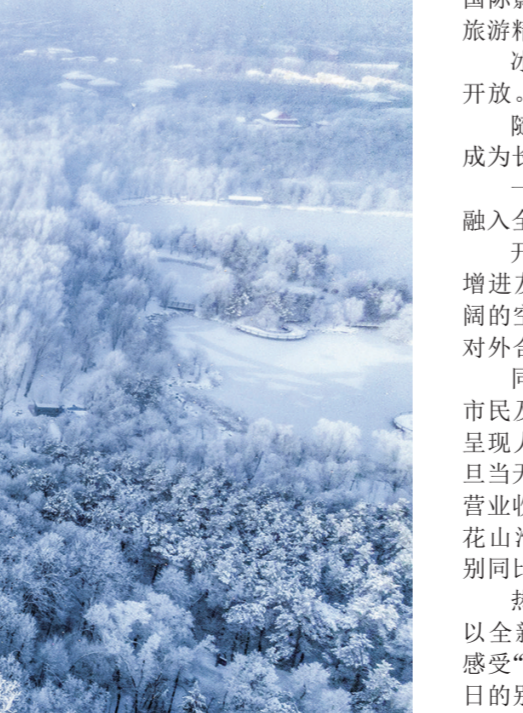
《银装素裹净月潭,何冬娜 摄

“吉林一号”创造超大宽幅宽视场光学遥感卫星最轻重量世界纪录;中国科学院长春光机所研制的1500米级深海基因测序仪测试成功;世界最大口径碳化硅反射镜、最大的中阶梯光栅、像素最高的CMOS传感器,一系列光学领域的关键技术并喷式涌现;长光华大、长光辰芯、长光辰芯等一批光学行业领军企业快速发展……一项项创新成果,正在加速长春向“新”、共筑起关键核心技术的新高地。