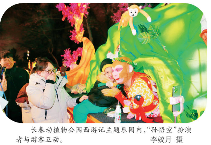
长春动植物公园西游记主题乐园内,“孙悟空”扮演者与游客互动。

从这有山、摩天活力城等商圈打造沉浸式消费新场景,到动植物园、莲花岛等国潮溜冰激活文旅新体验;从冰雪新天地“越夜越精彩”,到网红餐厅升腾的烟火气,这个春节假期,消费市场供需两旺,多元业态绘就出长春消费新图景。