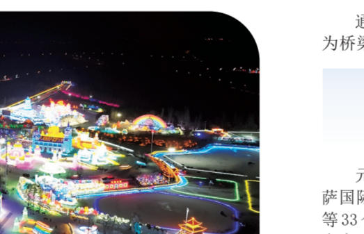
长春冰雪新天地 展展北国冰雪魅力。