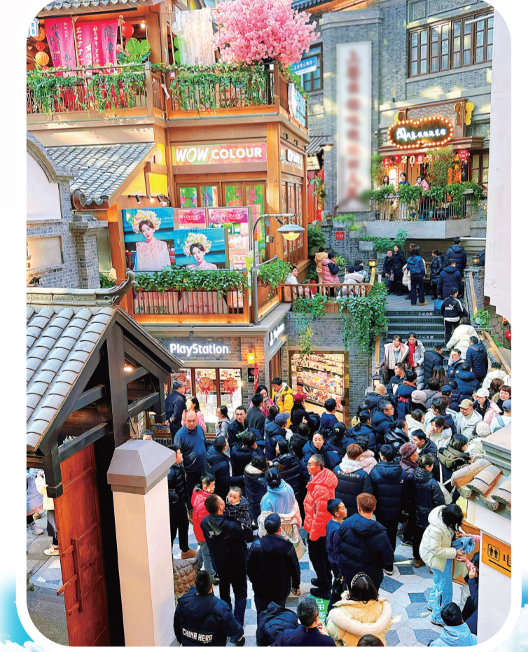
改造后的新天地威尼斯水街亦是人气爆棚,作