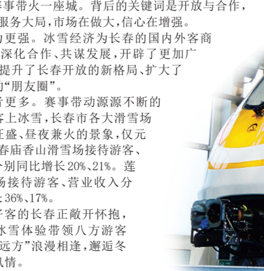
中车长春轨道客车股份有限公司研制的广东清远磁浮旅游专列。