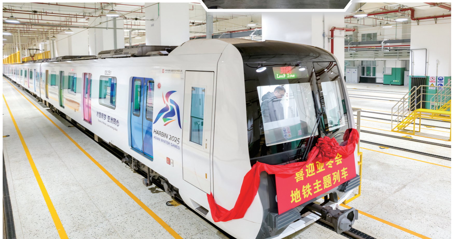
▲由中车长客自主研发生产的“逐梦亚冬号”主题地铁专列在2025年哈尔滨亚冬会期间上线运营。