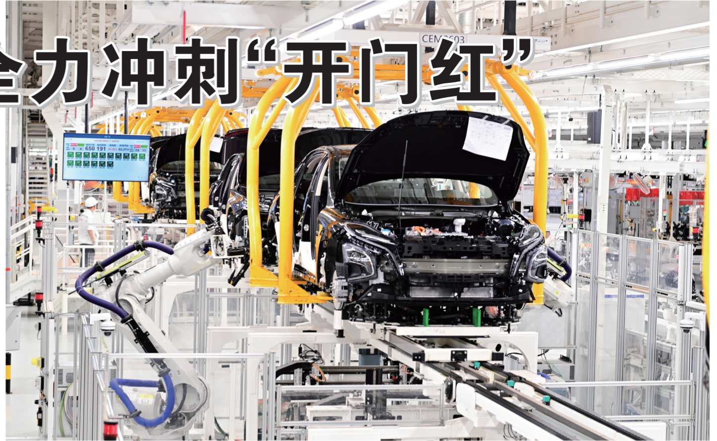
▲连日来,中国一汽旗下各大生产基地工作人员迅速投入到抓生产、保交付的工作中。他们争分夺秒、鼓足干劲,以昂扬的斗志全力冲刺首季“开门红”。图为红旗制造中心繁荣厂区总装车间。