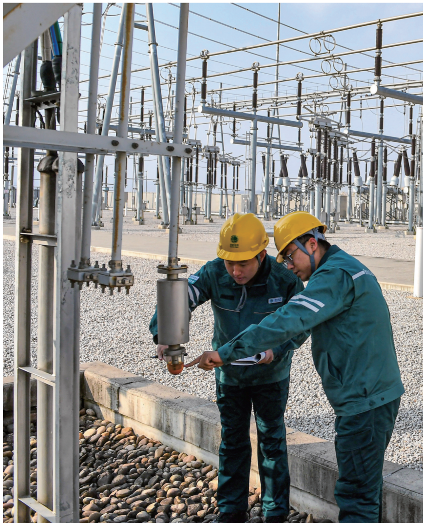
▼在国网吉林供电公司永吉220千伏变电站,变电运维工作人员检查设备运行情况,为千家万户的生产生活用电提供坚实保障。