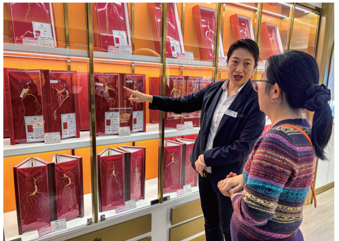
▲吉林省人参专班注重人参品牌建设,通过一系列的品牌宣传和推广活动,吉林人参的知名度和美誉度得到了显著提升,人参产品也在市场上取得了“开门红”。图为长春市欧亚卖场工作人员向顾客推荐人参产品。