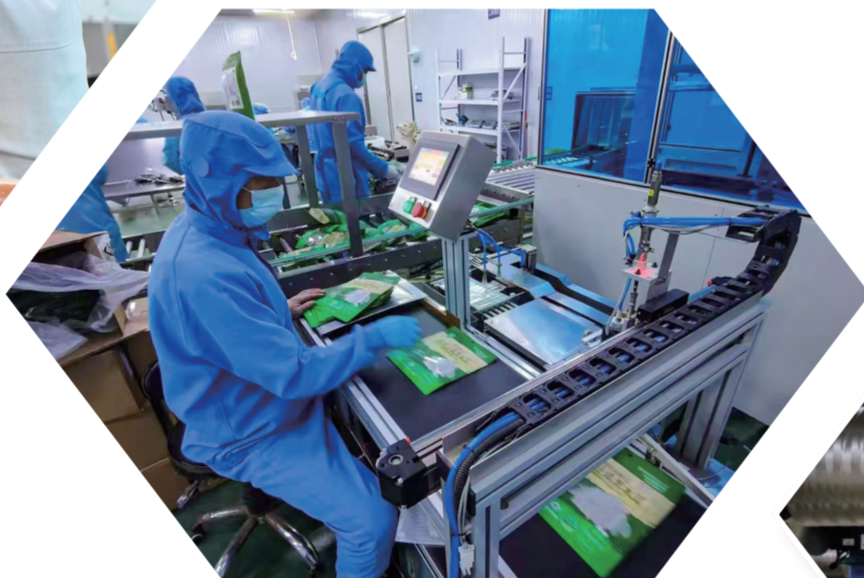
▲汪清县桃源小木耳实业有限公司抢抓生产、赶订单,全力以赴实现新年一季度“开门红”。