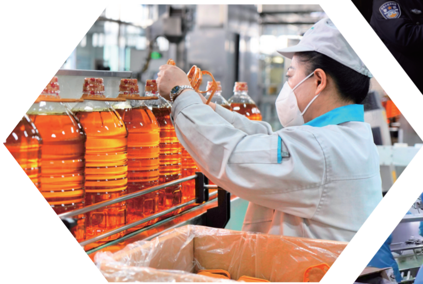
▲春节假期刚过,吉林出彩农业产品开发有限公司便开足马力抢抓生产,首个工作日便成功签下多笔大额订单。