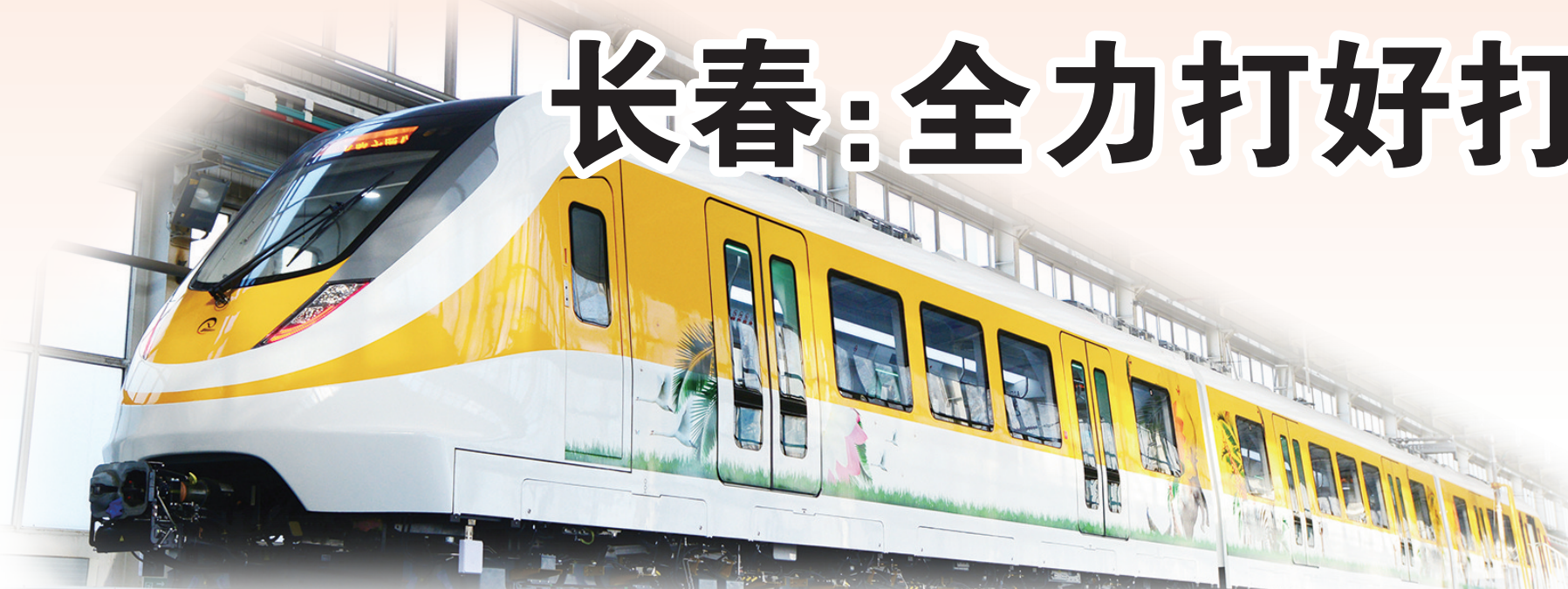
中车长客研制的广东清远磁浮旅游专列。