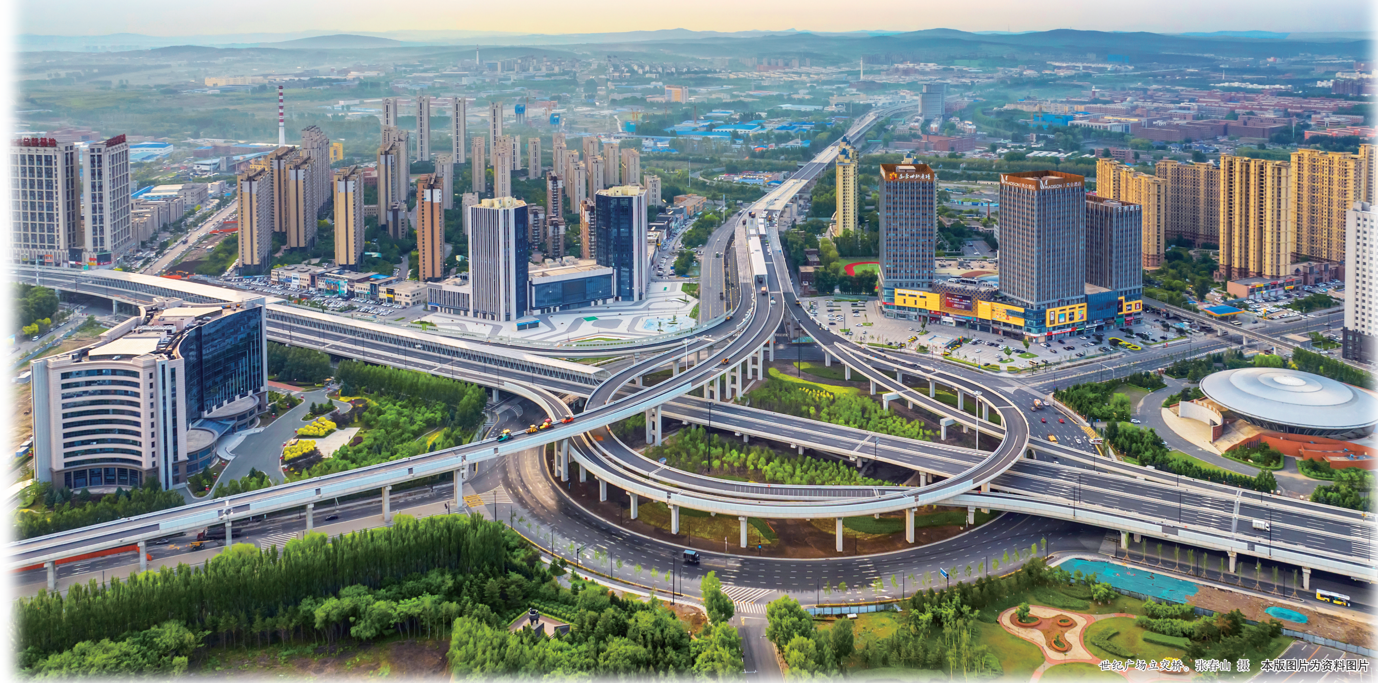
世纪广场鸟瞰图。摄影:孙 杰 本版图片均资料来源