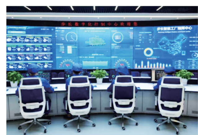
步长制药数字化控制中心。

智能化是高质量发展的必要途径,也是步长制药技术升级、效率变革和价值再造的关键一步。为巩固提升步长在产品的市场竞争力,步长制药引进了先进的生产设备和研发智能控制系统,成功实现中药炮制、提取、浓缩等工艺的自动化的“四化”(即生产装备智能化、制药过程连续化、资源利用集约化、绿色制造工程化)中药绿色智能制造技术模式。