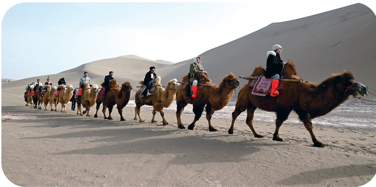
近日，游客在甘肃省敦煌市鸣沙山月牙泉景区游览。在冬季旅游优惠活动结束后，甘肃省敦煌市延续部分景区门票优惠政策，从3月1日至3月31日，鸣沙山月牙泉、玉门关遗址、敦煌雅丹世界地质公园三大景区推出门票半价优惠政策，吸引游客来这里欣赏大漠风光、体验丝路风情。